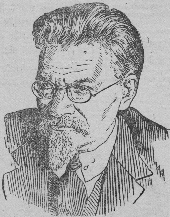
Председатель президиума Верховного Совета СССР тов. М. И. КАЛИНИН.

5. Касумов Мир Башир Фатах оглы, депутат от Сабир-Абадского округа, Азербайджанская ССР.