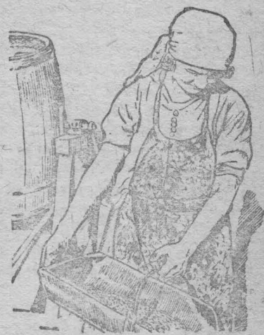
За сортировкой семян