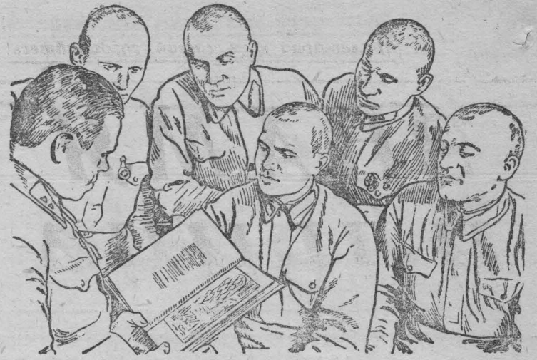
Войцы № части за чтением художественной литературы