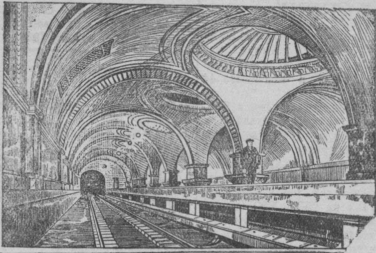
Строительство Московского метрополитена. НА СНИМКЕ: Перрон на станции „Сокол“