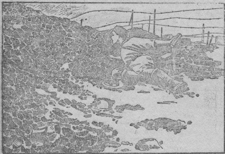
Гранатометчик республиканской Испании бросает гранату.

На других фронтах не отмечаются никаких значительных операций.