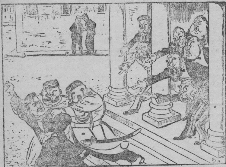
—Царское правительство обещало, что можно будет выставить в думу рабочих депутатов. —Вот рабочего депутата и „выставляют!“