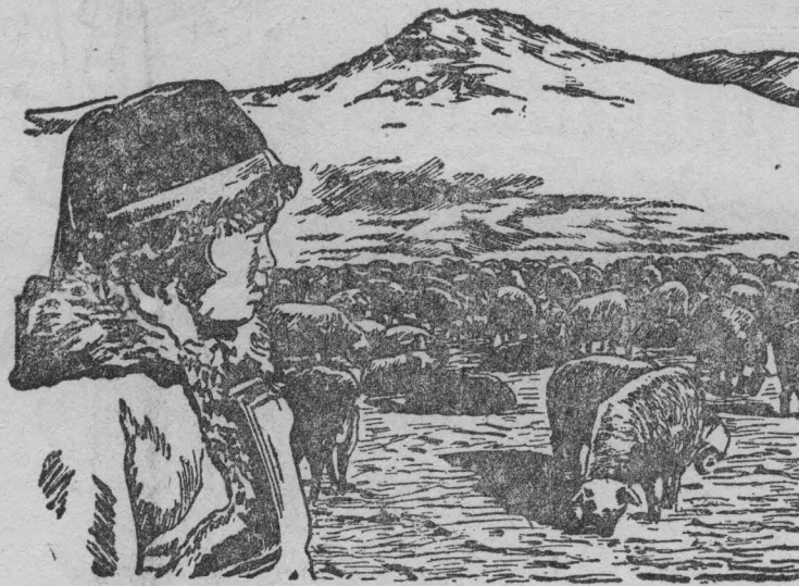
Овцы на выгоне в поле