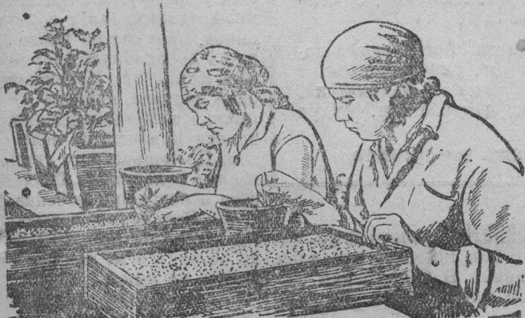
За проверкой семян на всхожесть.

Несколько живее и лучше оформляется газета рабочих механического цеха „Товарь“, где редактором работает тов. Ведерников. В ней всегда можете встретить всесторонний материал и с положительными и с отрицательными фактами, рисунки, карикатуры, ребусы, красиво написанные заголовки, освещение партийной и комсомольской жизни, заметки о лучших рабочих, передовиках производства, стихи и т. п.