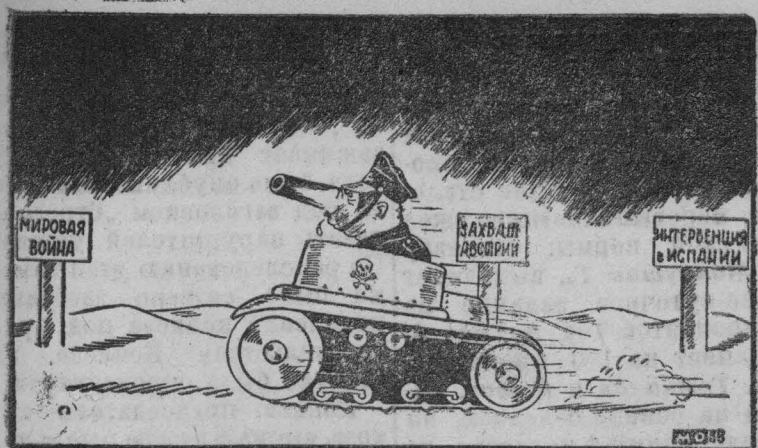
Столбовая дорога германского фашизма