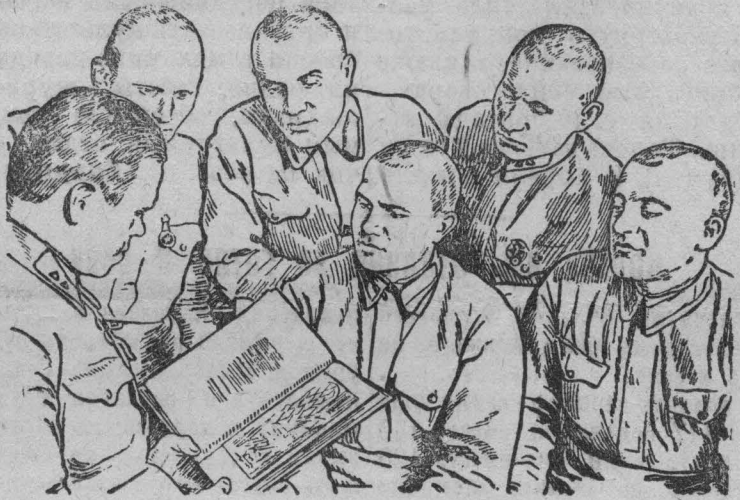
НА СНИМКЕ: бойцы Новосибирского полка изучают подожжение о выборах в Верховный Совет РСФСР.