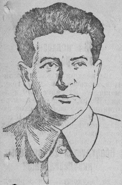
Заместитель Наркома обороны и начальник политуправления РККА т. Л. З. Мехлис