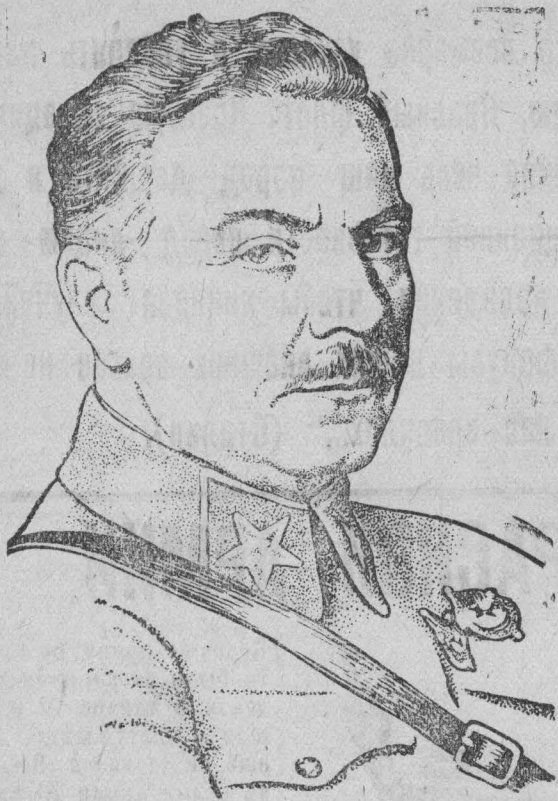
Нарком обороны СССР Н. Е. Ворошилов