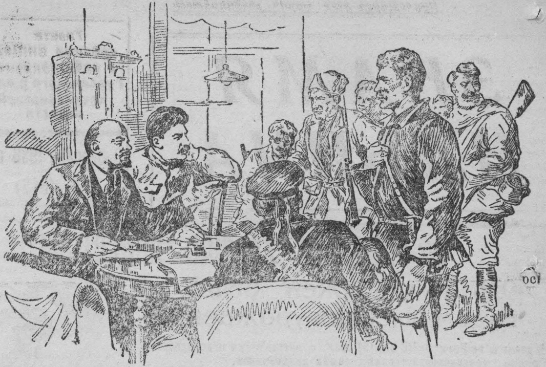
В. И. Ленин и И. В. Сталин с красногвардейцами в Смольном. 1917 год.