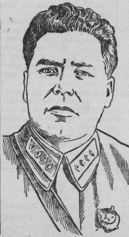
Народный комиссар по военно-морским делам СССР тов. П. А. Смирнов

Приветствую только что выслушанные декларации представителей Великобритании и Франции, я заявляю, что, не принадлежая к числу основателей Лиги наций и не неся, поэтому, за нее в такой мере ответственности моральной, как некоторые другие государства, Советский Союз готов попрежнему на максимальное сотрудничество с остальными лояльными членами Лиги».