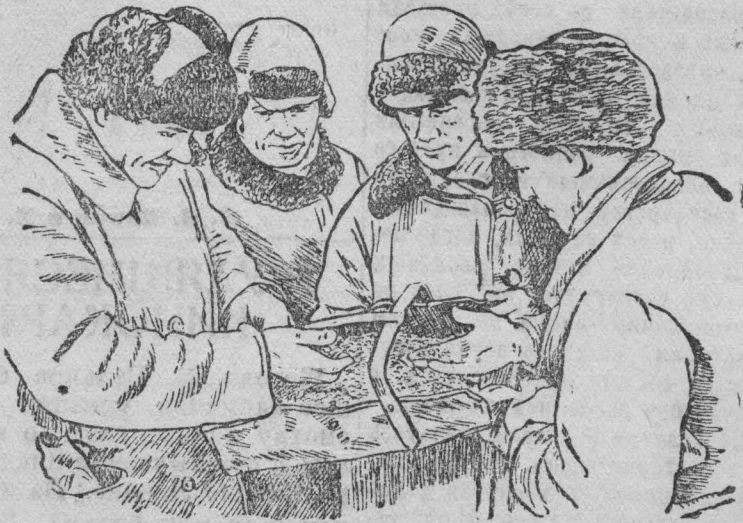
Колхозники проверяют качество семян

1938 год должен быть годом более высоких и устойчивых урожаев. Такова основная задача колхозов и мы ее должны выполнять с честью.