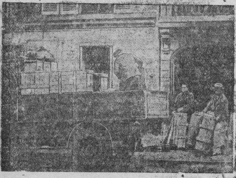
Инспектора французской полиции нагружают грузовик ящиками с конфискованным у фашистских заговорщиков оружием