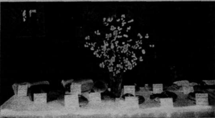
Фото с выставки продукции ОАО "Гурьевский хлебокомбинат"