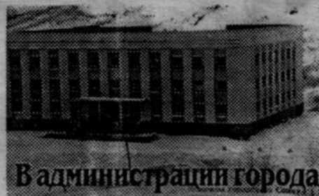
В администрации города

При этом в семье, где совокупный доход на одного человека не превышает установленного прожиточного минимума, собственные расходы на оплату жилья и коммунальных услуг в пределах социальной нормы площади жилья и нормативов потребления услуг не должны превышать половины установленного федеральным законом минимального размера оплаты труда на одного человека. В настоящее время он составляет 83,49 рубля. Субсидии предоставляются гражданам в безналичной форме в виде уменьшения их платежа за жилье и коммунальные