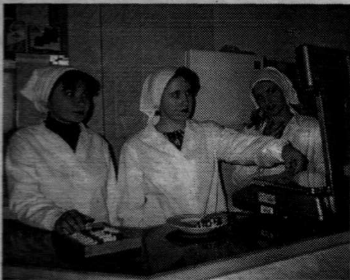
В лаборатории училища по профессии повар-продавец девушки осваивают азы своей специальности

И мы, педагоги профессиональной школы, создаем огромную ответственность дела, которому служим. Ведь какими будут они, молодые рабочие, входящие в XXI век, таким будет и будущее.