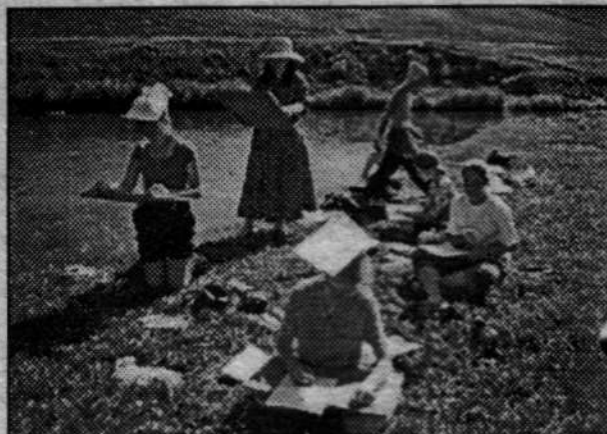
Пленэр на Милково, 1999 год