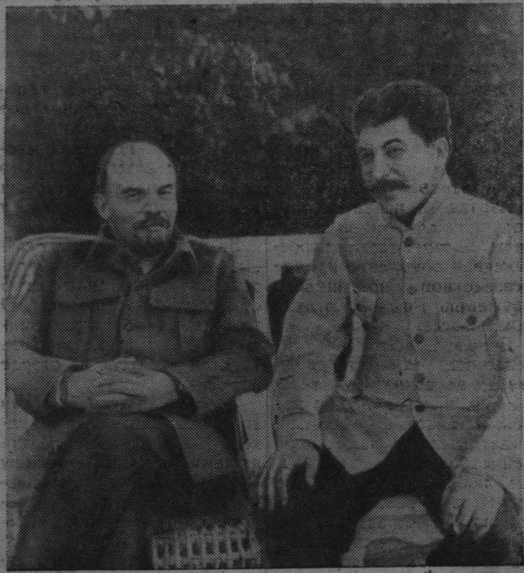
В. И. Ленин и И. В. Сталин в Горках. 1922 год.