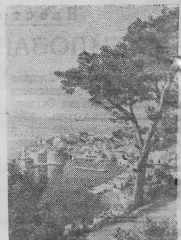
В Федеративной Народной Республике Югославии. Город Дубровник.

Памятник И. В. Сталину, в г. Тыргу-Муреш БУХАРЕСТ. (ТАСС). По случаю 76-й годовщины со дня рождения И. В. Сталина в городе Тыргу-Муреш, на площади Советских героев, состоялась торжественное открытие памятника И. В. Сталину.