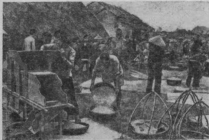
ДЕМОКРАТИЧЕСКАЯ РЕСПУБЛИКА ВЬЕТНАМ, Сдача риса государству.