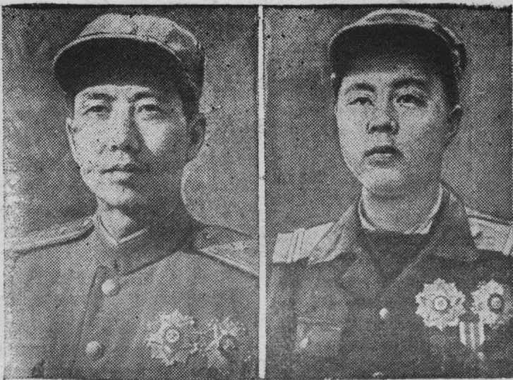
1. Генерал-лейтенант Нан Хо Сан (слева).