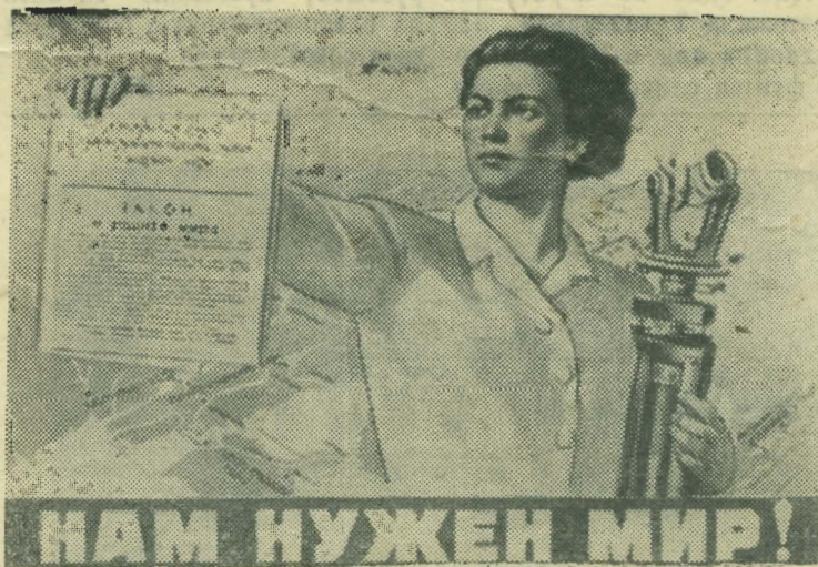
Иллюстрация работы художника Б. Белошольского.

Сейчас передовые бригады развернутое соревнование за достойную встречу Великого Октября.