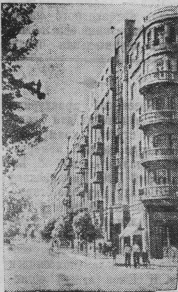
АСТРАХАНЬ. Советская улица.