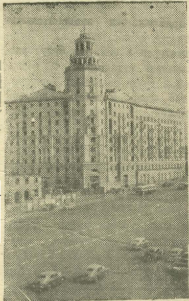
Москва. Новый дом на Садово-Самотечной улице.

На большинстве заводов проведена реконструкция, позволяющая увеличить выпуск продукции. Мощность некоторых заводов возросла в полтора раза.