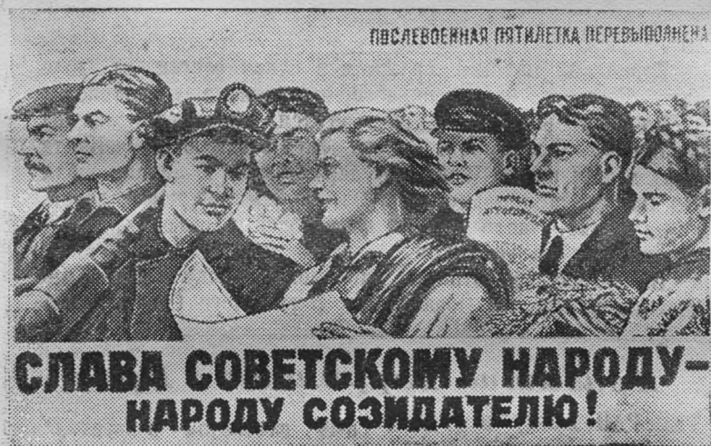
Плакат худ. Ватолина.

САВЧЕНКО, горный мастер 15 участка шахты 9-15.