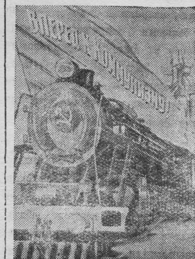
Плакат худ. Б. Иванова.

Работники отдела помогли тов. Аникштейну наметить конкретные мероприятия, направленные на улучшение партийно-организационной и политической работы.