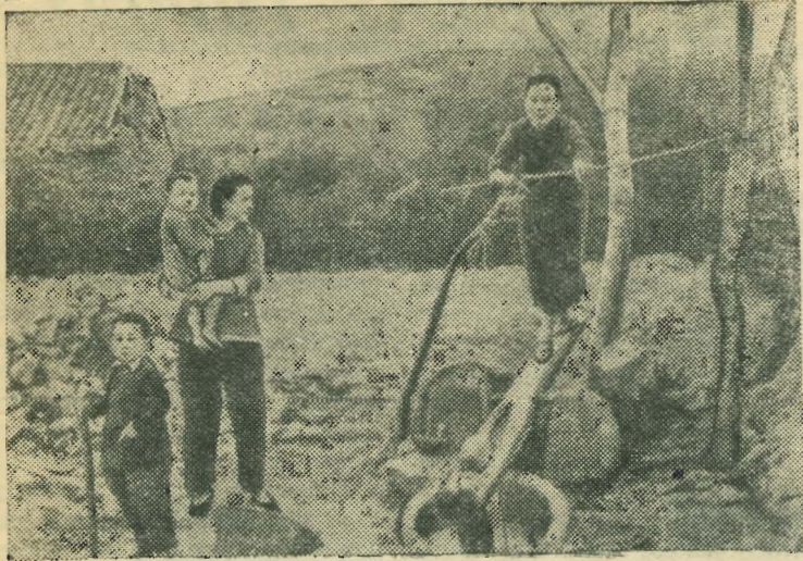
Китайская народная республика. Крестьяне обмолочивают рис.