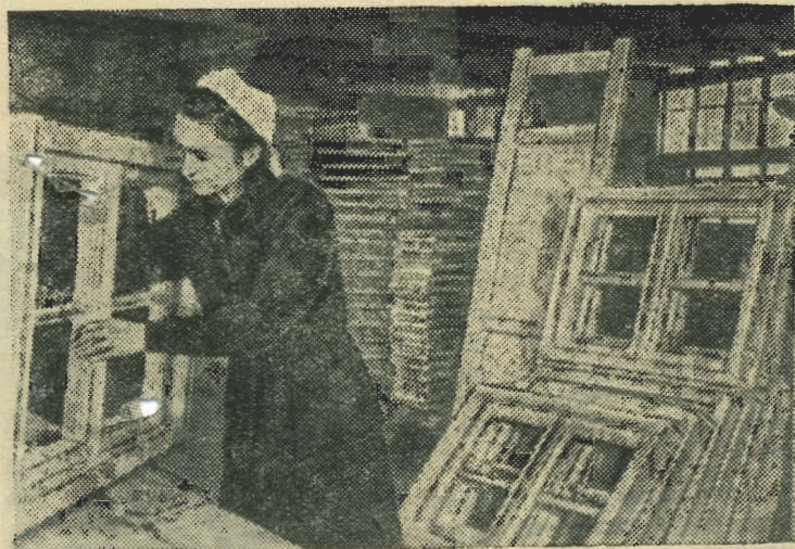
Брянская область. Дятьковский завод стандартного домостроения изготавливает для лесозащитных станций Ставропольского края и Сталинградской области каркасные щитовые индивидуальные дома. Для Дубовской и Орловской лесозащитных станций уже отправлено 13 таких домов.

В апреле 25 рабочих различных профессий получают специальности машинистов грузочных машин.