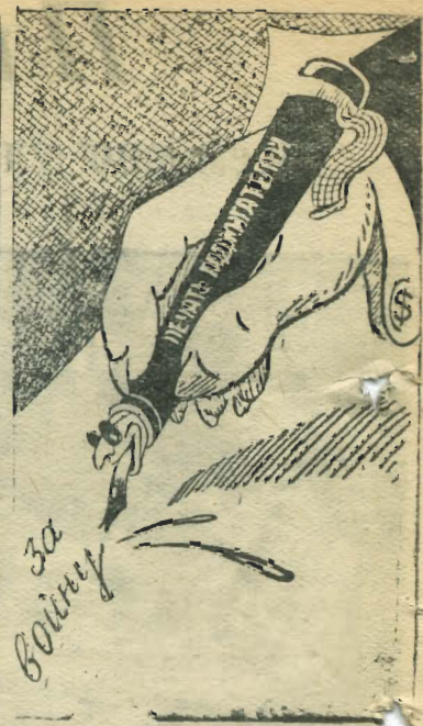
Почерк Уолл-стрита Рис. А. Зубова.