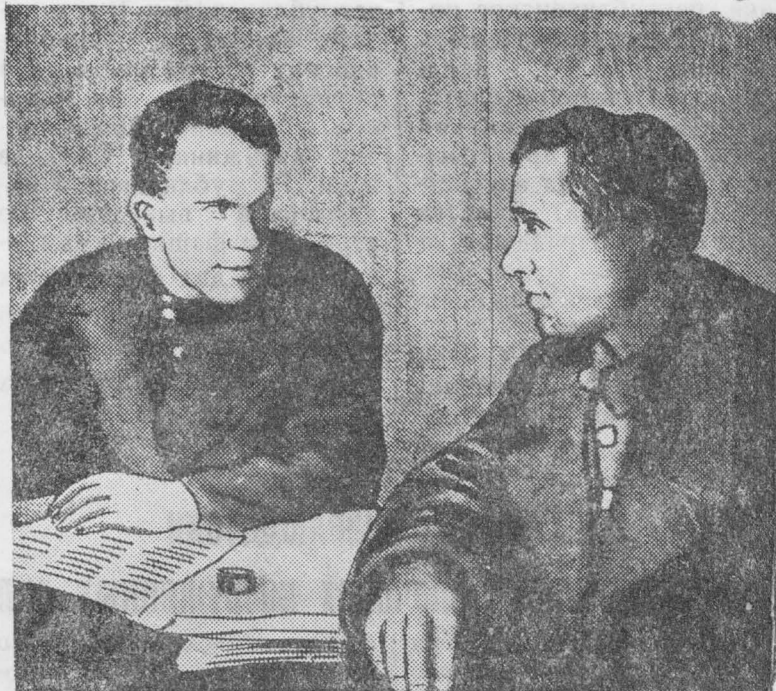
С 10 октября на шахтах треста „Анжероуголь“ начался стахановский месячник.