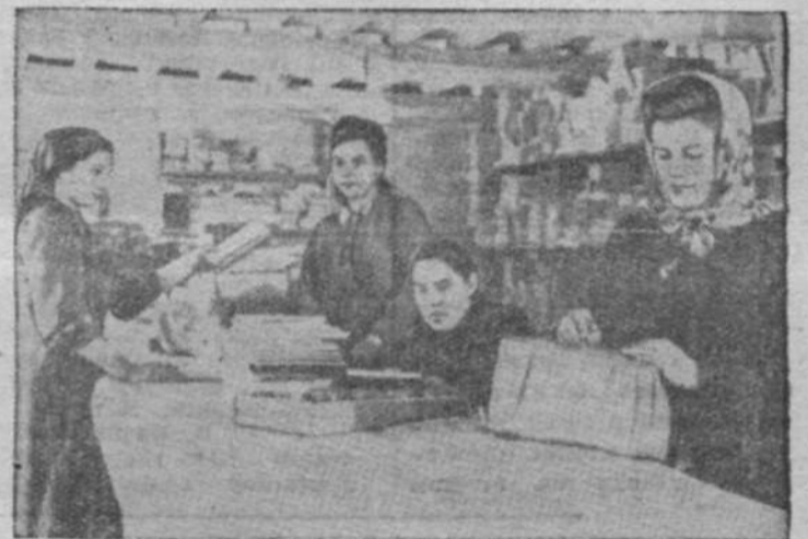
Областной библиотечный коллектор каждый квартал отправляет в районы много разнообразной литературы для пополнения сельских библиотек.