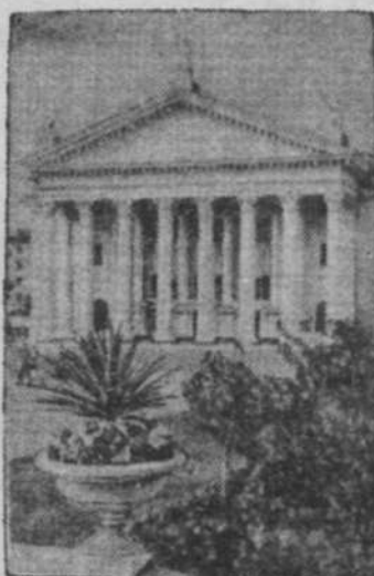
Сталинград. Восстановленное и реконструированное здание областного драматического театра имени М. Горького на площади Павших борцов.