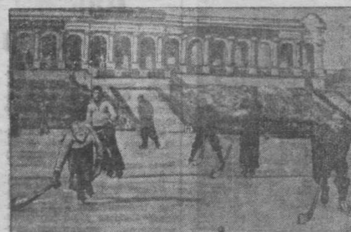
На снимке: момент встречи на первенство ЦС ДСО «Шахтер» по хоккею между командами Кемерово и Ворошиловграда.