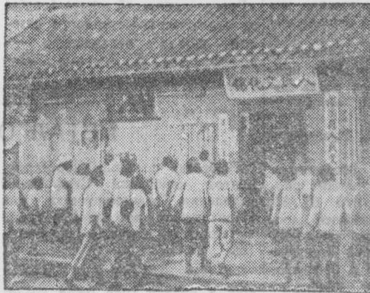
В деревнях Китайской Народной Республики создается много культурных учреждений, куда приходят крестьяне послушать лекцию, почтить газеты и журналы. На снимке: крестьяне деревни Луаньнань-сянь (провинция Таншань) у Дома культуры.

Южнее Чхольвоня (центральный фронт) и севернее Янгу (восточный фронт) части Народной армии отбивали яростные атаки войск американско-английских интервентов.