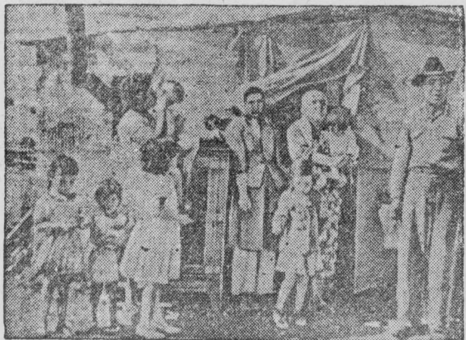
Американский образ жизни означает беспощадную эксплуатацию рабочих, безработицу, голод и нищету широких масс трудящихся. На снимке: в городе Сан-Антонио (штат Техас). Лачуга из брезента, дерюги и картона, в которой ютятся семья из 11 человек.