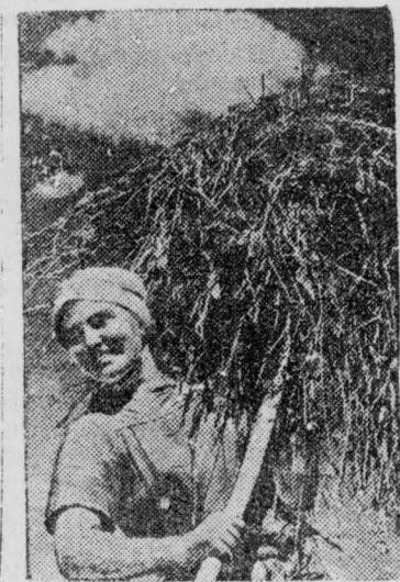
Совхоз «Сталинец» Кузнецкого комбината завершает уборку се-на.

комбайнер Поморцевской МТС Беловского района.