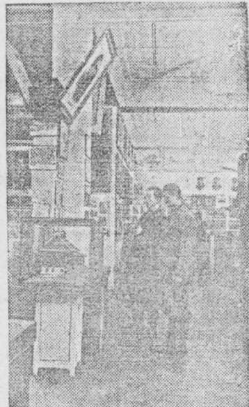
Широкой популярностью у жителей г. Сталинска пользуется краеведческий музей. На снимке: в одном из залов музея.