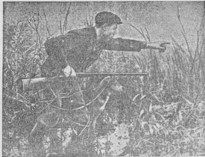
В выходной день на охоте.

12 октября в Бомбее (Индия) полиция открыла огонь по базирующимся рабочим-текстильщикам. Убито два и ранено восемь рабочих. (ТАСС).