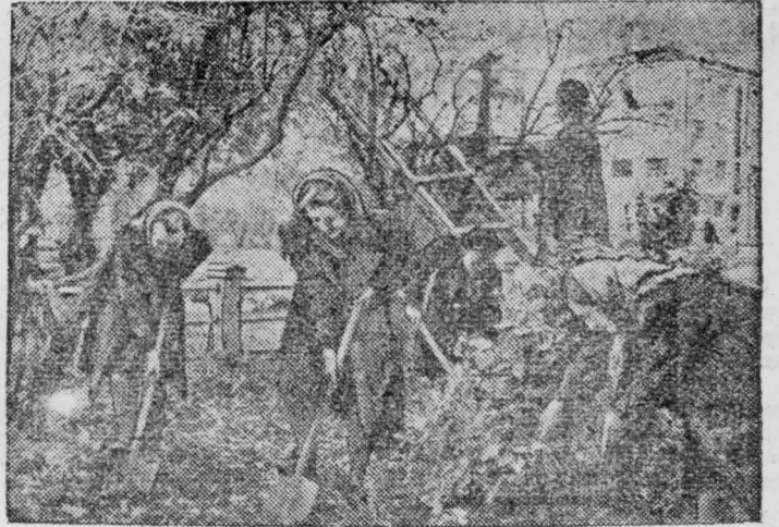
Неделя сада. На снимке: учащиеся Кемеровской школы № 41 на воскреснике по озеленению города.