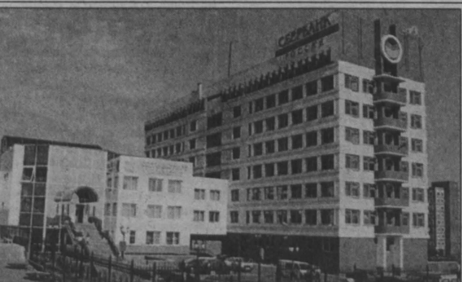
Кемеровское отделение Сберегательного банка.

на 01.10.02г. учреждениями Сбербанка России эмитировано почти 130 тыс. банковских карт, в т.ч. 2,3 тыс. шт. карт крупнейших международных платежных систем. Владельцев карт обслуживают 121 учреждение банка, 56 банкоматов, 319 торговых сервисных предприятий. В последнее время на рынке появились такие новые, специализированные для групп населения, карточные продукты, как Maestro «Студенческая», Maestro «Пенсионная», облегчающие процесс получения стипендии и пенсионных выплат, дающих право на скидки в торговых сервисных предприятиях на территории России и за рубежом, а также Visa Аэрофлот с льготами для пассажиров Аэрофлота. Много внимания уделяет банк и улучшению качества обслуживания населения. Например, в октябре в пяти дополнительных офисах Кемеровского ОСБ установлены электронные кассиры (каш-диспенсеры), обслуживающие клиента не более одной-двух минут. Большое внимание в работе банка уделяется обслуживанию юридических лиц (предприятий, организаций), частных предпринимателей. На сегодняшний день ими открыты в учреждениях банка, работающих в области, более 25 тысяч расчетных, текущих, бюджетных счетов. Совокупный остаток средств достиг 1,7 млрд. руб. и 3,8 млн. дол. США. Доля средств корпоратив-