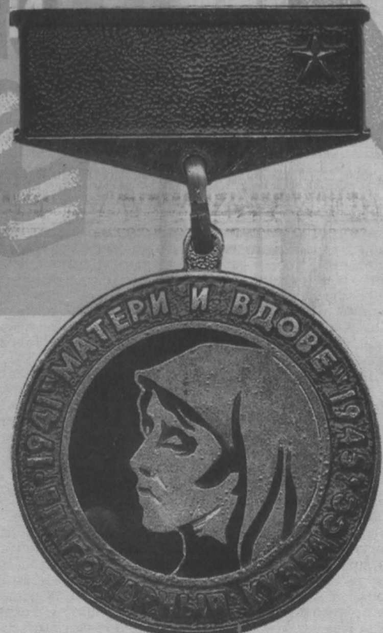
Наградной знак «Матери и вдове 1941-1945 благодарный Кузбасс».