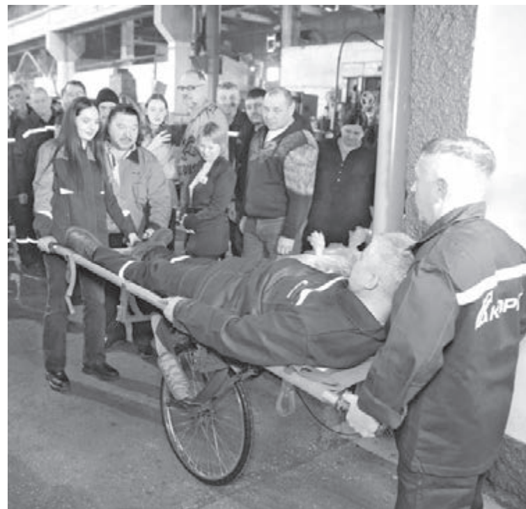
■ Демонстрация использования комплексов для эвакуации раненых.

Производством комплексов для эвакуации вклад работников завода в приближение Победы не ограничивается. Руководство предприятия решило запустить патриотическую акцию, направленную на помощь нашим бойцам. Суть её заклю-