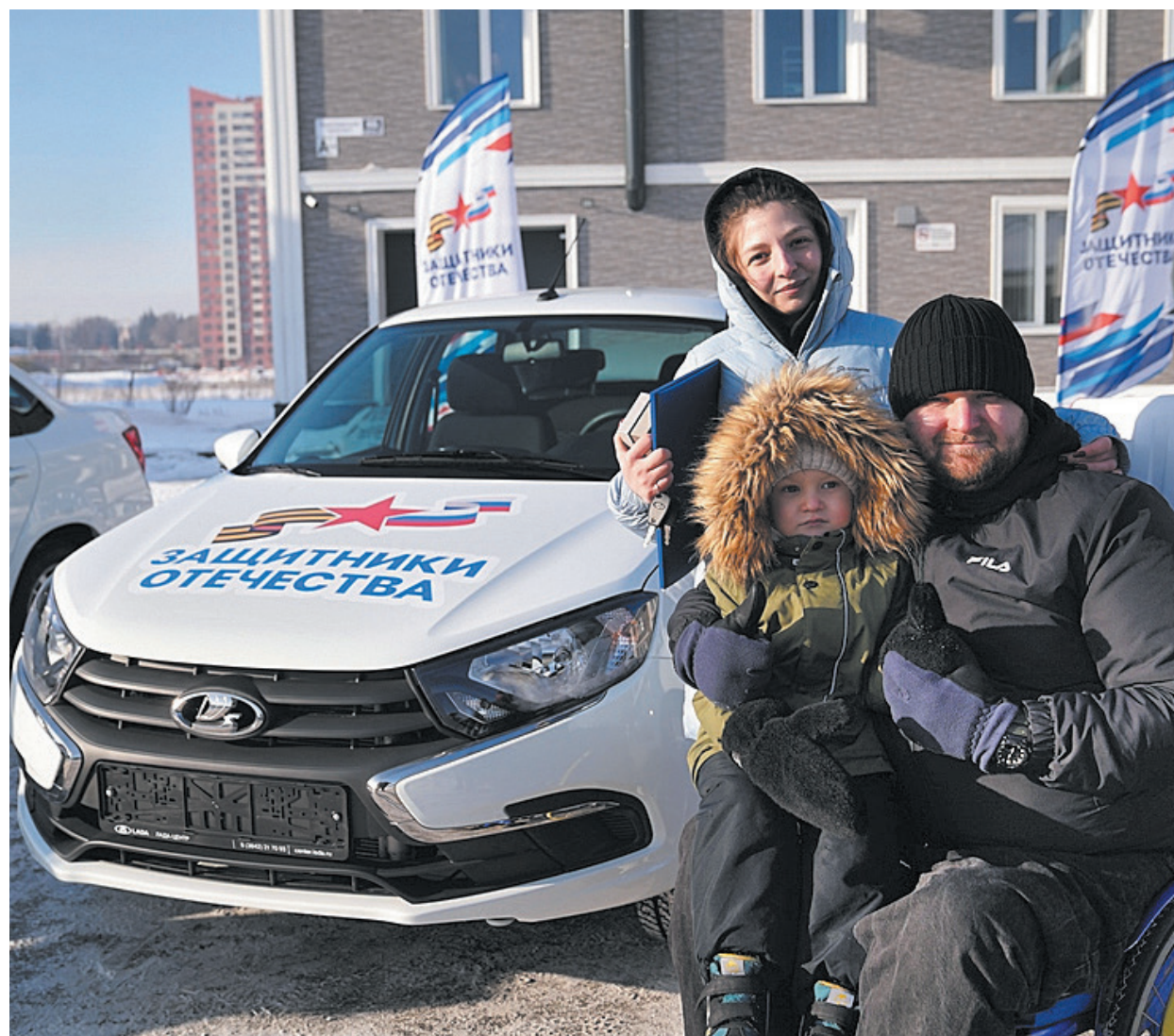
■ Фото Сергея Шпица.