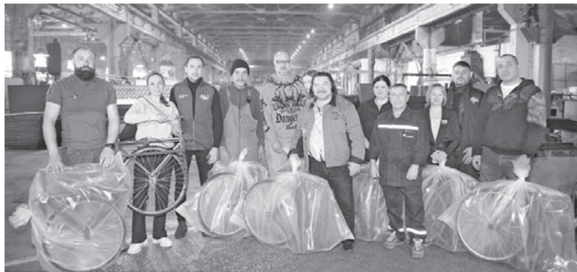
■ Фото Сергея Шпица.