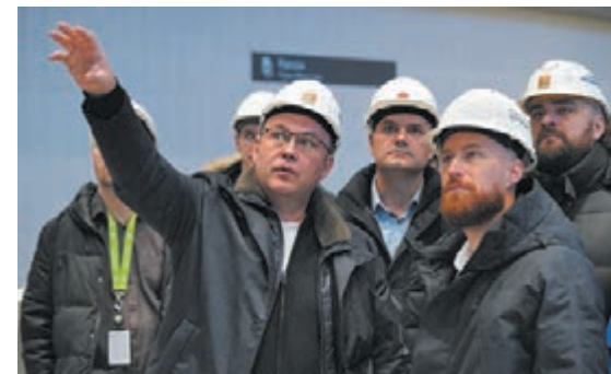
■ Фото пресс-службы администрации правительства Кузбасса.