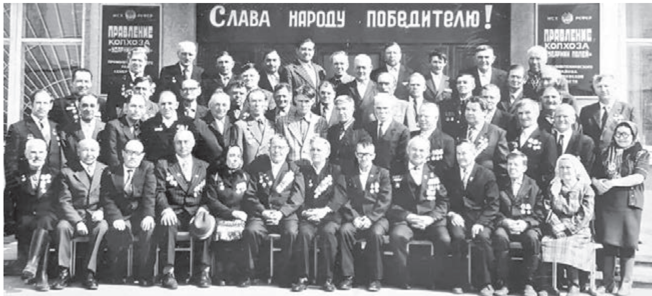
Участники колхоза «Ударник полей», среди них – папа (седьмой справа во втором ряду).