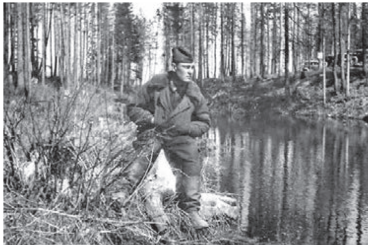
■ Фото Е. С. Буравлёва. 1941–1945 гг. Из фондов Государственного архива Кузбасса.

Личный фонд Е. С. Буравлёва в Государственном архиве Куз-