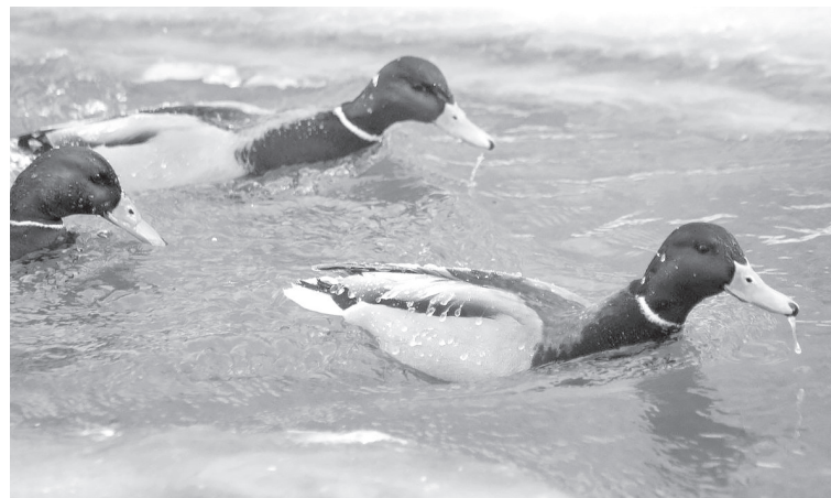
■ Фото Елены Радостевой.

Считать птиц зимой проще оттого, что все они находятся примерно в одном месте: возле открытой части водоёма. Обычно в день акции стояли морозы и справиться с этой задачей было несложно, так как полынья была небольшой. В этом же году