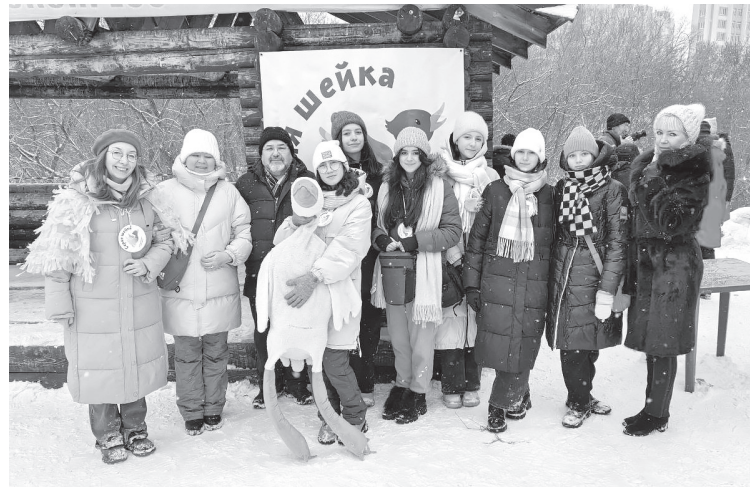
■ В акции в Кемерове приняли участие более 500 человек.

участникам пришлось разыскивать уток на большей территории оттаявших водоёмов.