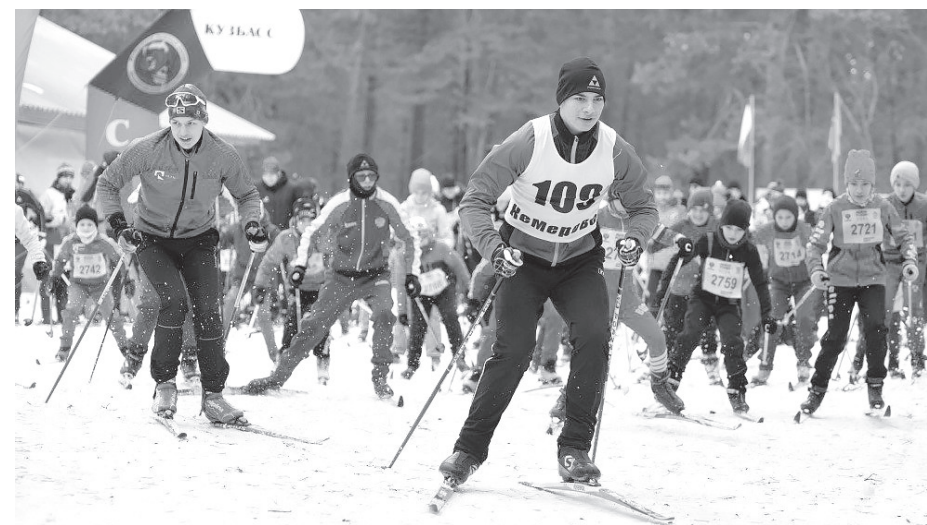
■ Фото предоставлено пресс-службой администрации правительства Кузбасса.