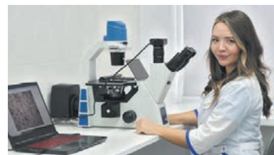
■ Фото с сайта администрации правительства Кузбасса.