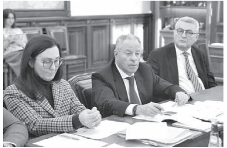
Участники проекта строительства современного мусоросортировочного комплекса в Кемеровском муниципальном округе.

Производственно-технический комплекс по переработке и обезвреживанию твёрдых коммунальных отходов будет включать в себя производственно-технические и складские помещения, пункт весового контроля, газовую котельную, гараж. Строящийся комплекс полностью соответствует требованиям национального проекта «Экологическое благополучие». Для обработки