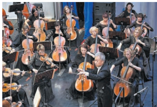
■ Губернаторский симфонический оркестр Кузбасса.

«Песни сердца» в исполнении Максима Павлова, талантливый тенор и композитор из Беларуси, продолжат фестивальную программу. Под аккомпанемент Губернаторского оркестра русских народных инструментов Максим исполнит русские народные песни и авторские композиции на стихи классиков: Пушкина, Лермонтова, Есенина, Рубцова. Максим уже покорила Кремлёвский дворец съездов, Концертный зал имени Петра Чайковского Московской филармонии, большой зал Санкт-Петербургской академической филармонии имени Дмитрия Шостаковича. Теперь белорусский тенор готов покорять сердца кузбасских зрителей.