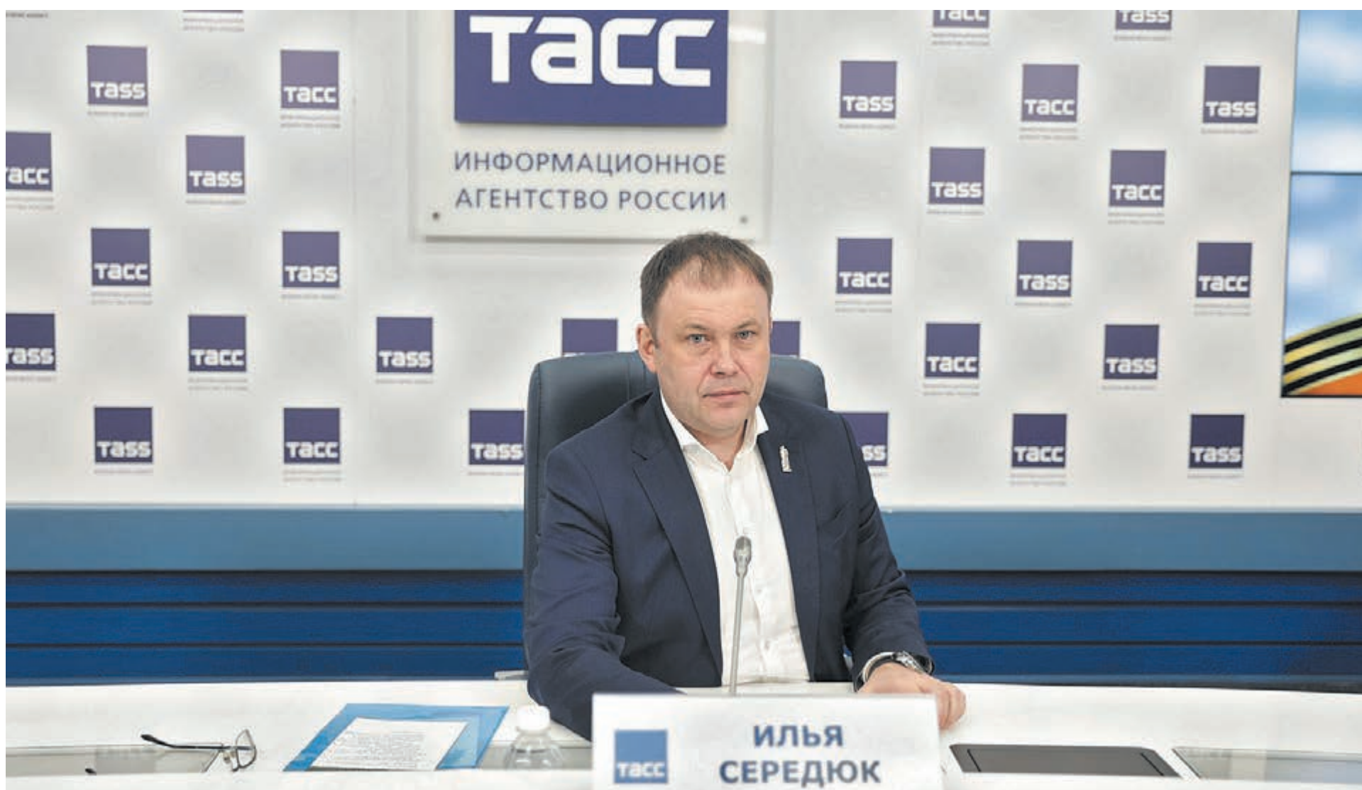
■ Фото ТАСС.