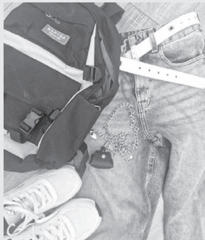
■ Фото автора.