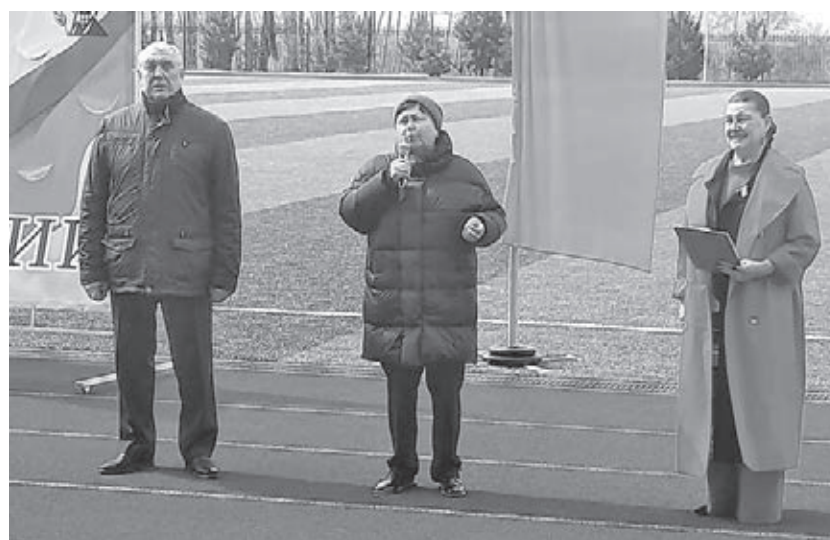
■ Торжественное открытие спартакиады.