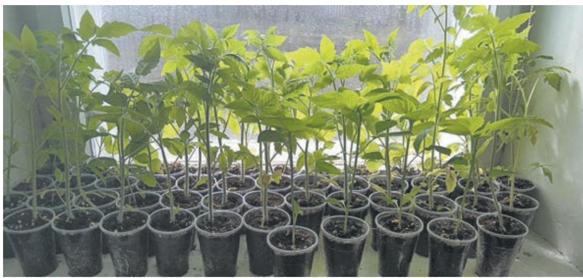
■ Фото из личного архива Александра Резвиха.