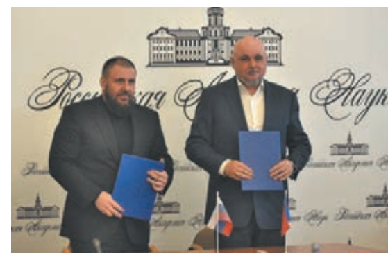
■ Фото с сайта АПК.