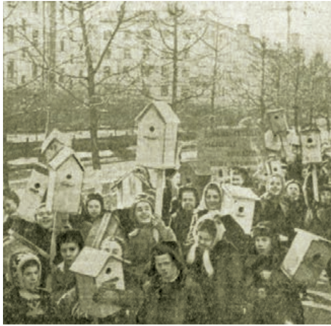
■ Фото П. Костюнова.