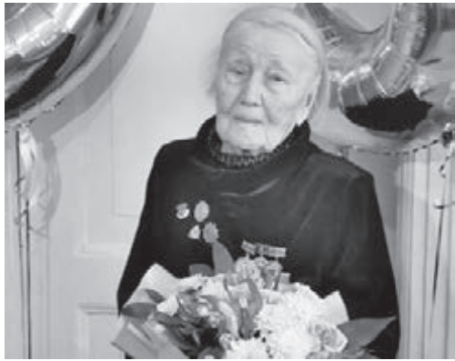
■ Фото администрации г. Кемерово.

охранения СССР, хирург-стоматолог высшей категории, 66 лет отдала любимому профессиональному делу. На протяжении 26 лет избиралась депутатом районного и городского советов народных депутатов.