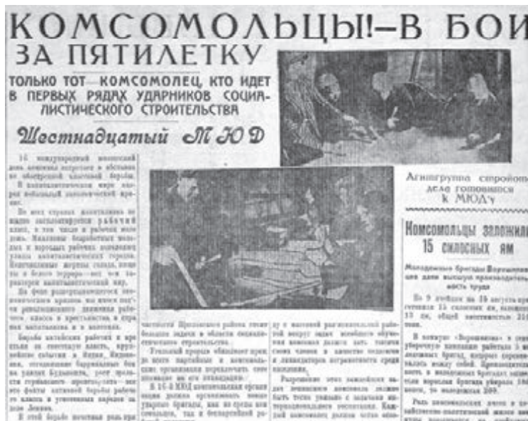
Фрагменты публикаций из газеты «Кузбасс» за 6 сентября 1930 года.

«Для того чтобы ввести всеобщее обучение, для того чтобы охватить тысячи неграмот-