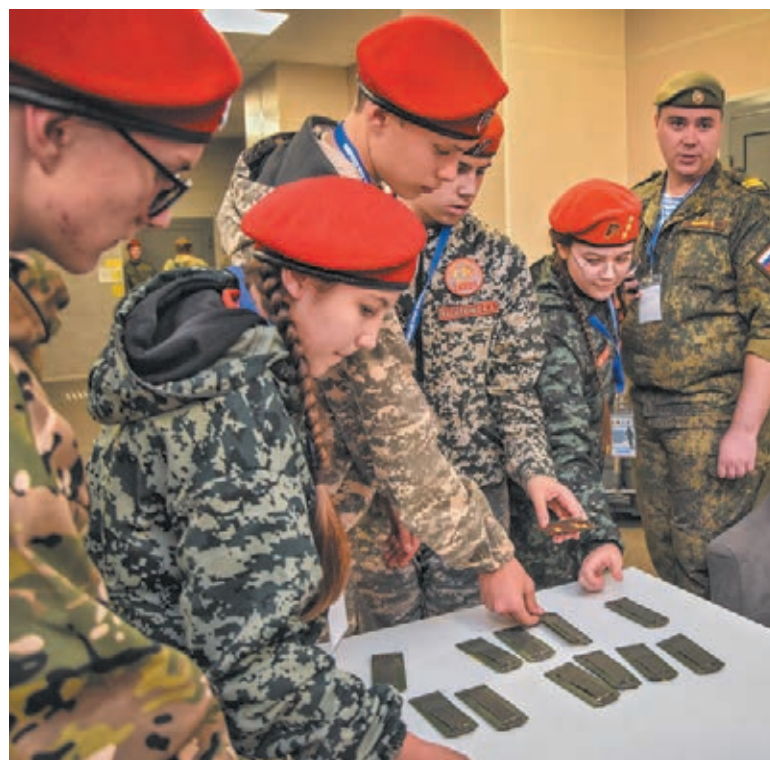
■ Фото Анастасии Жуковой.

Для справки. Организаторы Всероссийского турнира юнармейцев – Кузбасское отделение «Юнармии» совместно с правительством Кузбасса, министерством образования региона и УФСБ России по Кемеровской области – Кузбассу.