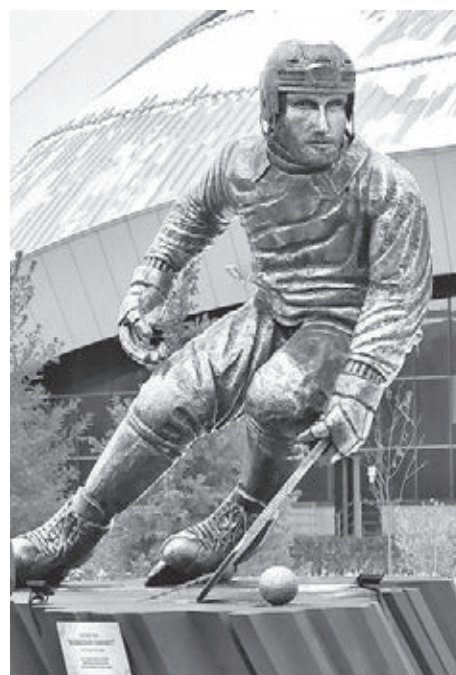
Памятник хоккеисту у Ледового дворца «Кузбасс».