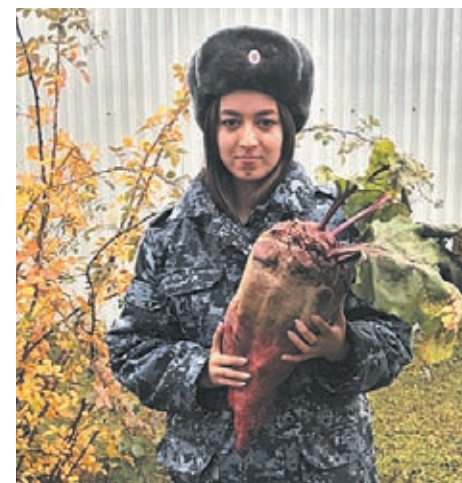
■ Фото ГУФСИН Кузбасса.

Практически все культуры на участках осуждённых выращивают на высоких грядах. В тех местах, где на следующий год планируют сформировать делянки, в конце сезона выкапывают яму и закладывают в неё шелуху от лука, ботву и другие органические остатки. После чего яму зарывают и уже на будущий сезон землю перекапывают.