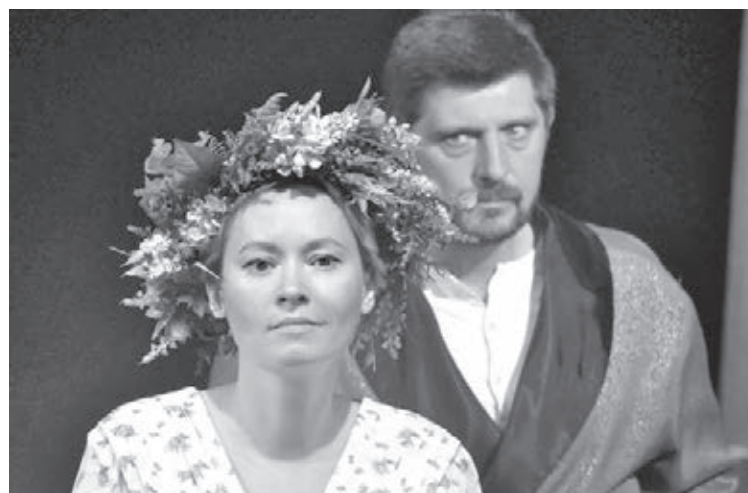
■ Фото Юрия Кузнецова.

– Ирина Николаевна, почему был выбран именно Островский?