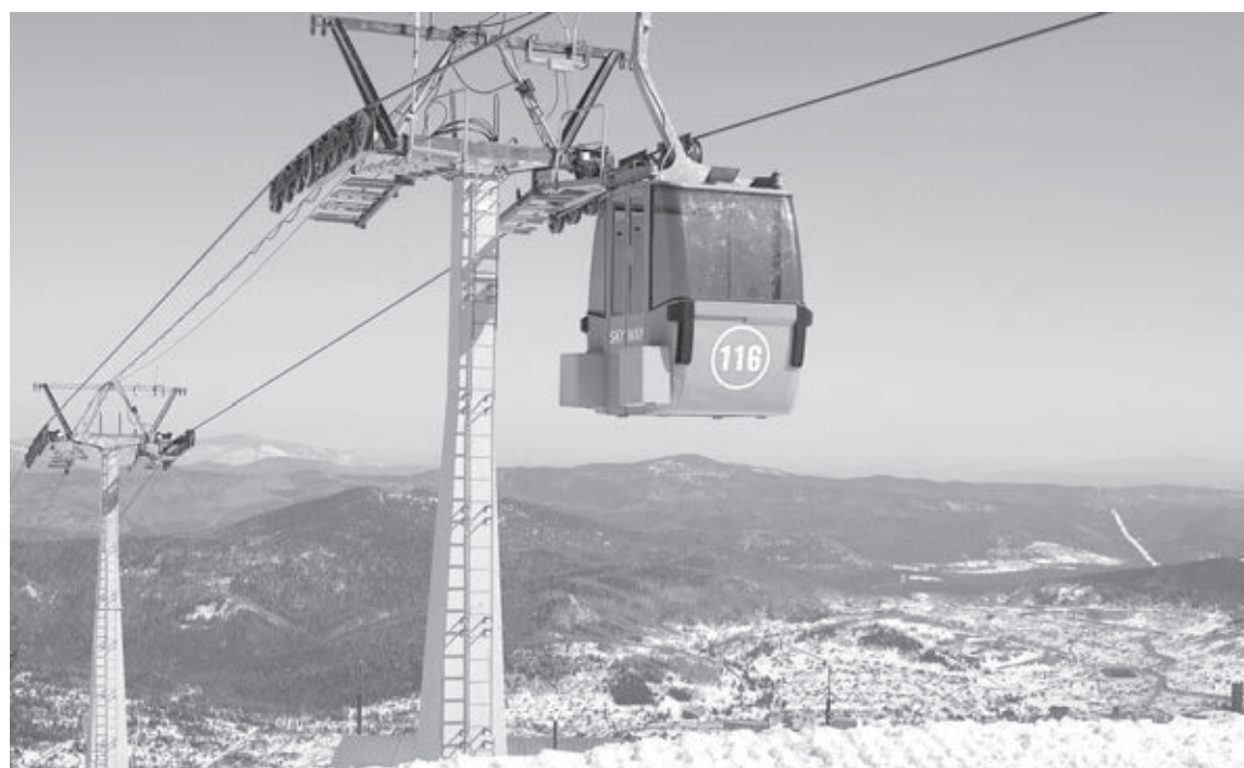
■ Фото Константина Полюцкого.

Ежегодно в преддверии открытия горнолыжного сезона все горнолыжные объекты региона проверяются межведомственной комиссией с участием специалистов Роспотребнадзора, Ростехнадзора, Ростехнадзора, МЧС и других ведомств. Комиссия начнет работу 8 ноября в Таштагольском районе и завершит 8 декабря в Кемерове.