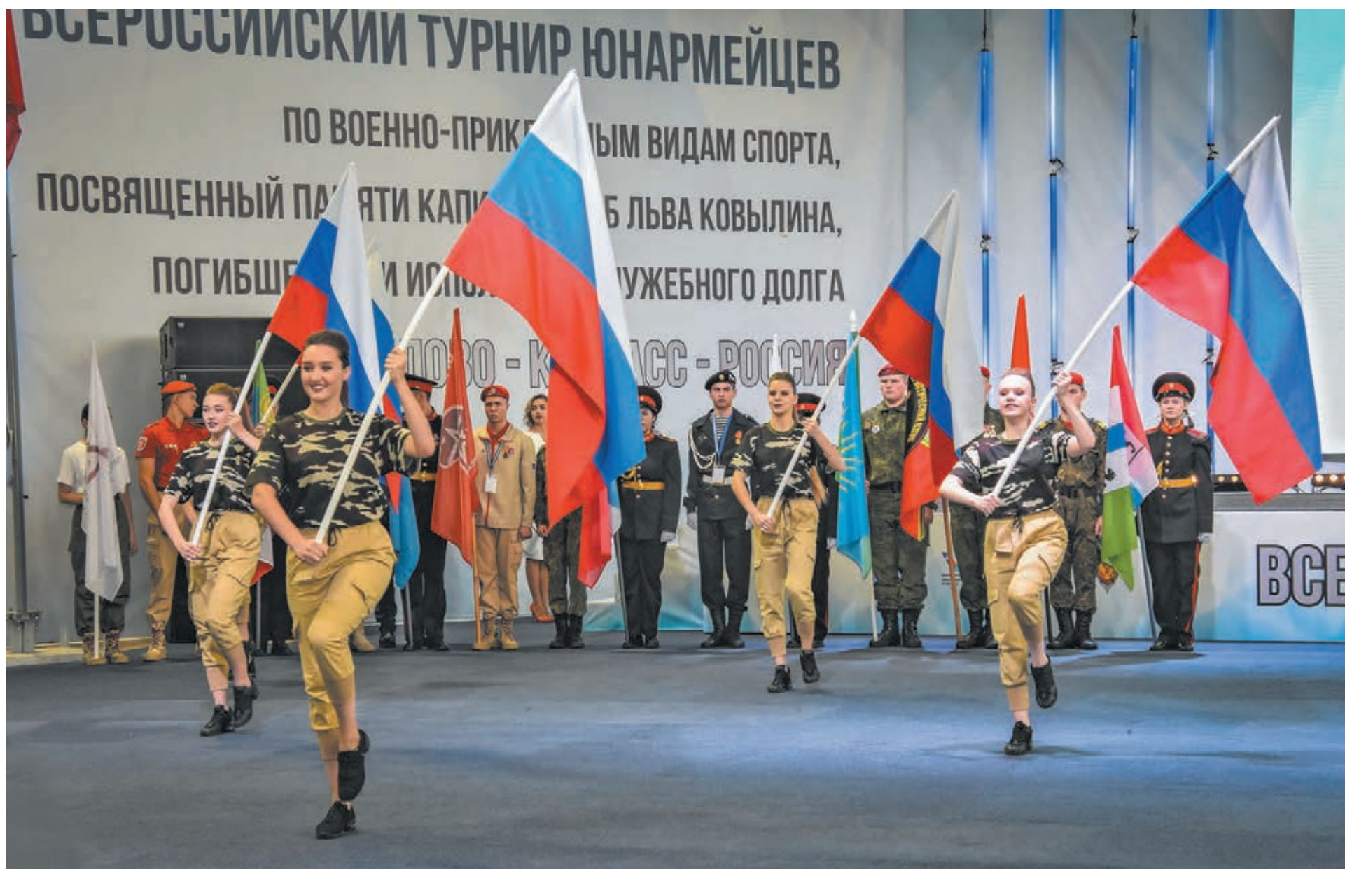
■ В Кузбассе к движению «Юнармия» присоединилось уже более 35 тысяч школьников.