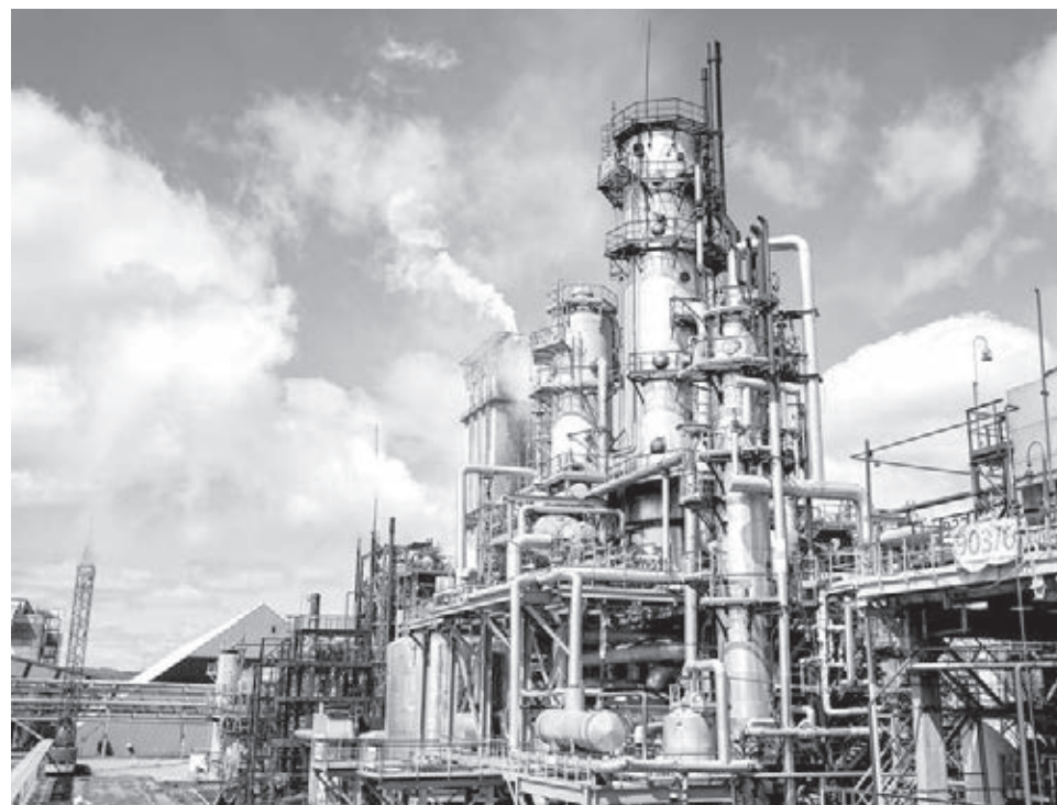
■ Даже на крупном заводе результат зависит от работы каждого отдельного человека.