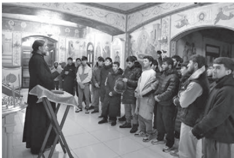
■ Фото Сергея Шпица.

Одна из традиционных конфессий Кузбасса – ислам. В 2008 году в Кемерове открылась самая большая за Уралом мечеть – «Мунира», которая одновременно может размещать около 400 прихожан. Туда экскурсионная группа приехала в первую оче-