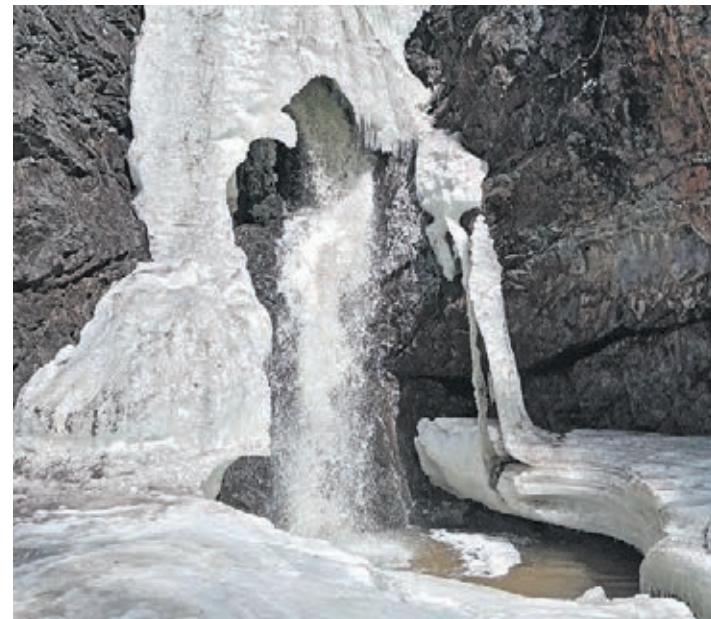
Материалы полосы подготовила Алена Смирнова.