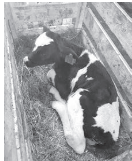
■ Фото Алены Смирновой.