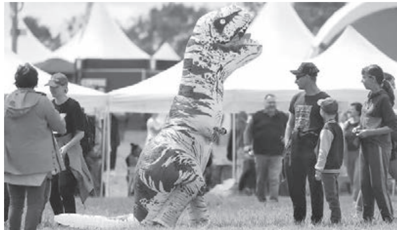
■ Фото предоставлено министерством культуры и национальной политики Кузбасса.