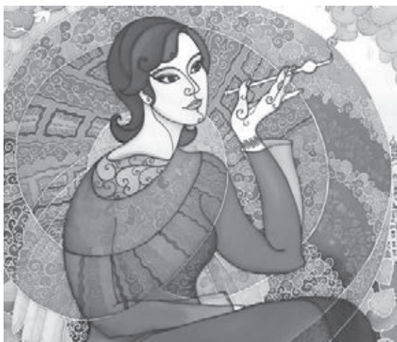
■ Фото предоставлено беловской галереей «Вернисаж».