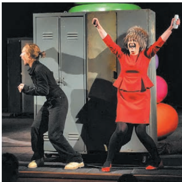
■ Момент спектакля «Горка».