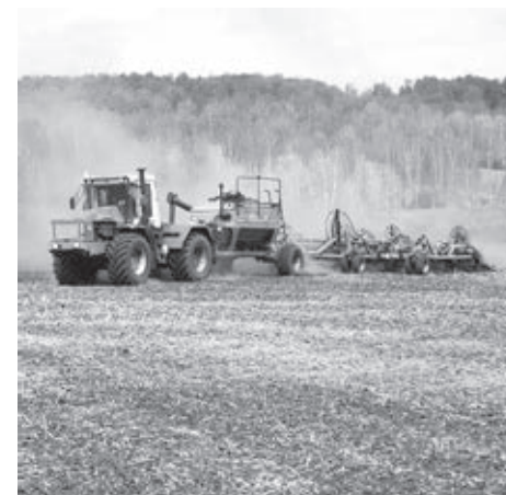
■ Фото регионального минсельхоза.

Напомним: в 2022 году аграрии в Кузбассе получили рекордный урожай зерновых – почти 1,8 млн тонн.