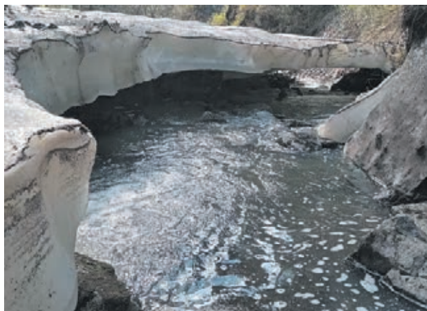
■ Фото Елены Юшковой.

Картину дополняет фотогеничная ледяная шапка, формирующая наверху ледяное поле. «Ледяные поля в преддверии лета вызывают неподдельный восторг у наших туристов», – добавила Елена.