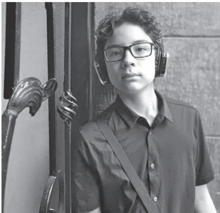
■ Подростки очень нуждаются во внимании и безусловной любви родителей. Будьте рядом в это непростое время.

Хочу предложить родителям одну методику, которой пользуюсь в своей практике уже очень много лет. Она поможет не только сформировать адекватную самооценку ваших детей, но и укрепить взаимоотношения в семье. Это «ДНЕВНИК ДОСТИЖЕНИЙ». И так, вам необходимо завести какую-то тетрадь или блокнот, в который вы совместно с вашим ребёнком / подростком будете записывать все его / её достижения за день. Делать это нужно ежедневно, например, вечером. В этот же дневник можно записывать достижения каждого члена семьи. Если пока не представляете, что можно вписать в дневник, предлагаю несколько вариантов. Отметить можно за выражение собственного и аргументированного мнения, принципиальность в сложных ситуациях, помощь близким, умение доводить дело до конца, хорошее настроение и оптимизм, желание изменить мир к лучшему, мужество и многое другое. Так вы увидите, что ваши дети, супруг или супруга вносят значительный вклад в жизнь всей вашей семьи. Потому что, после долгого существования рядом, наше видение другого человека может становиться «смазанным» или даже негативным. А «дневник достижений» поможет посмотреть на ваших близких с другой стороны.