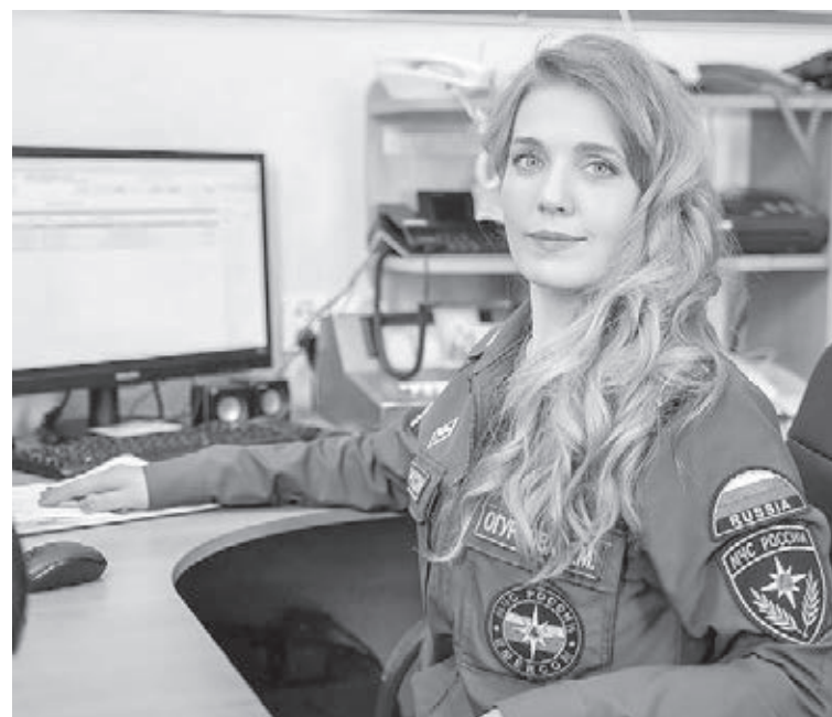
■ Фото пресс-службы администрации Юргинского городского округа.

Девиз Елены: «Я смогу! У меня всё получится!». И действительно всё получилось. В подобном конкурсе юргинке