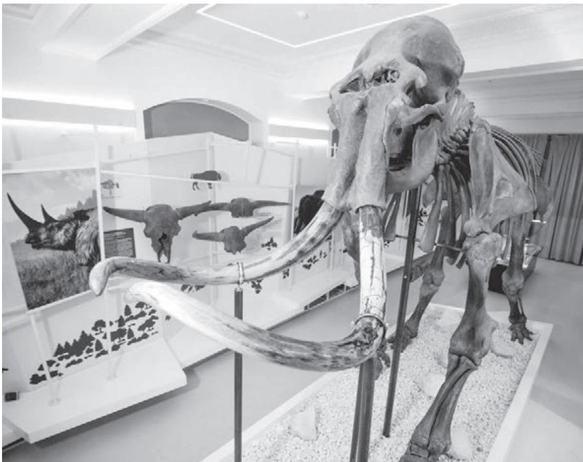
Музейный экспонат – скелет взрослой особи шерстистого мамонта.