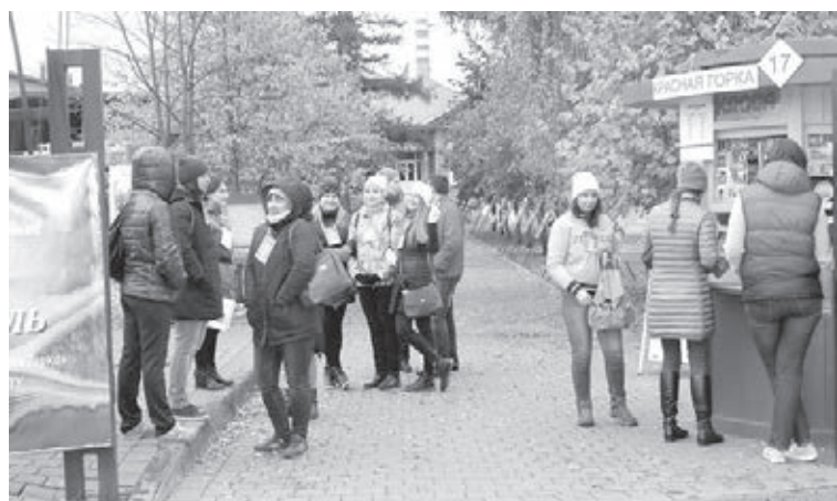
Мероприятия в музее-заповеднике «Красная Горка» всегда вызывают большой интерес у горожан, «Ночь искусств» не исключение.

Одним из интересных событий станет презентация дизайн-проекта индустриального исторического парка «Красная Горка», а специально для «полночников» в свете шахтёрских головных светильников на территории музея состоится экскурсия «Первым был Копикуз». Вход свободный.