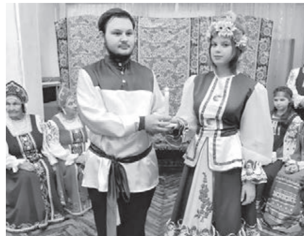
■ Фото с сайта управления культуры Таштагольского района.