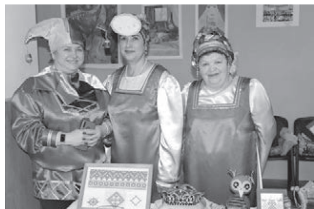
■ Фото с сайта администрации Беловского округа.