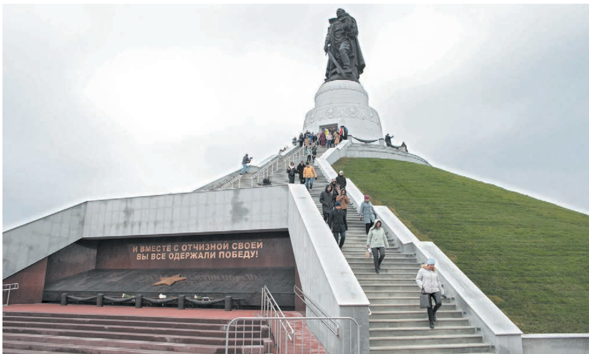
■ Мемориал Воину-освободителю в Кемерове.