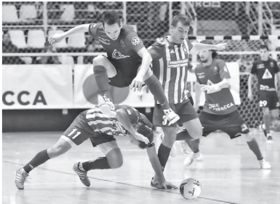
■ Кемеровский «Кузбасс» (игрок команды на переднем плане) в новом сезоне готов прыгнуть выше головы.

– Команда заработала себе имя, успешно выступая в российских соревнованиях. «Кузбасс» – это гордое название. Конечно, игровые виды спорта – финансово затратные, но без них никак нельзя. Команда будет играть в «Кузбасс-Арене», которая откроется в ближайшее время. Профессиональным клубам требуется частно-государственная поддержка: и бюджетные деньги, и деньги бизнеса. Тогда клуб будет развиваться: своя ин-