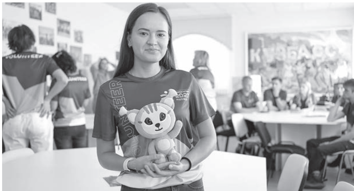
■ Фото пресс-службы АПК.