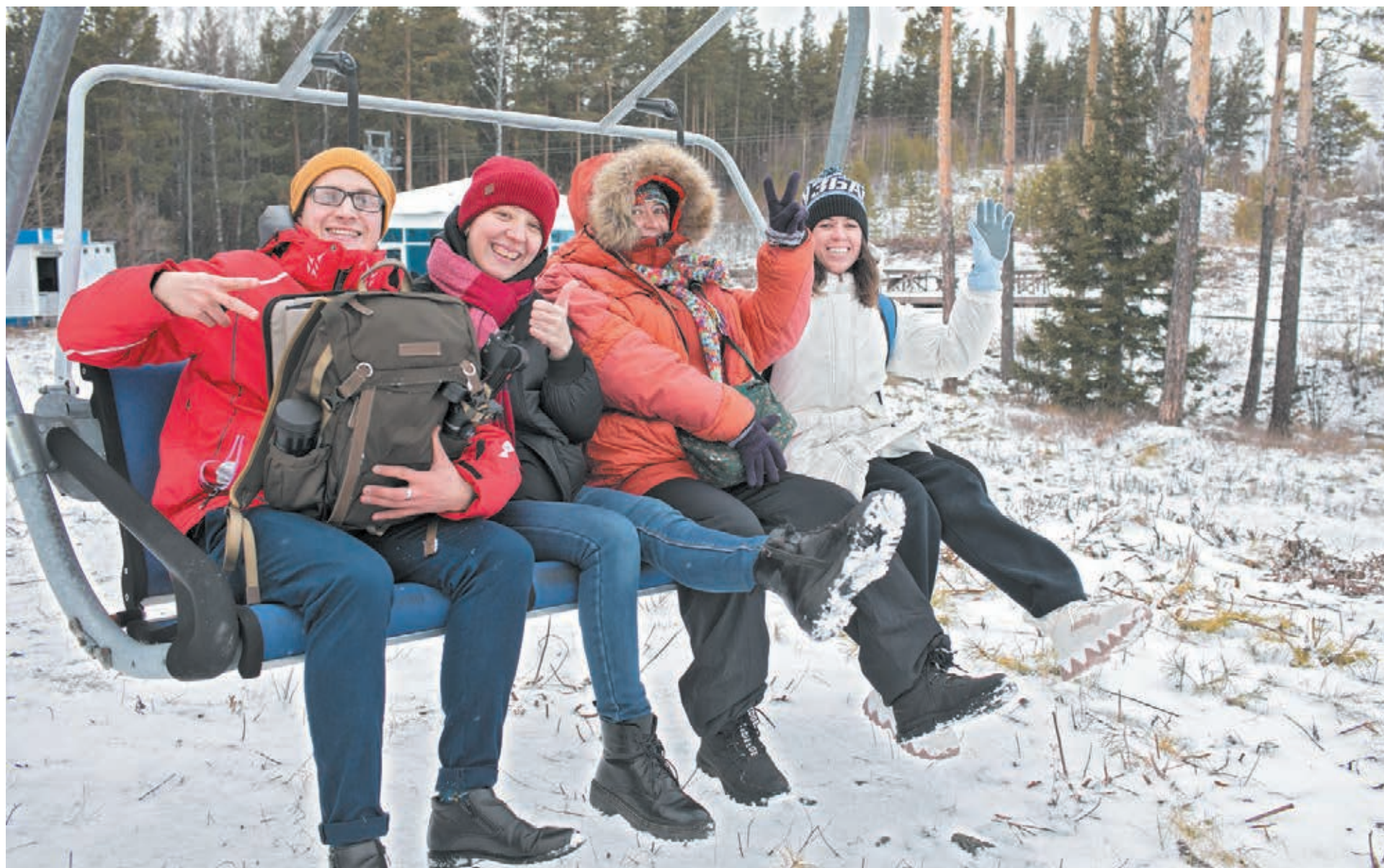
■ Фото Сергея Гавриленко.