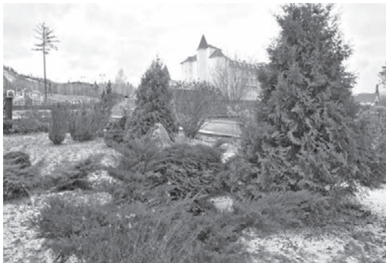
■ Открытие горнолыжного сезона на «Танае» запланировано на начало декабря.

Кстати говоря, прокатный фонд на «Танае» к открытию сезона был значительно приумножен, поэтому должно хватить всем. Напомним: на прокат можно взять не только спортивный инвентарь, но и экипировку.