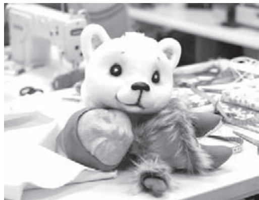
■ Фото предоставлено театром кукол Кузбасса.

Театр кукол Кузбасса имени Гайдара подготовил очень тёплый спектакль, приуроченный к Году культурного наследия народов России. Последней премьерой уходящего года станет постановка для детей старше трёх лет «Умка» от режиссёра Веры Каратаевой из Санкт-Петербурга. Сегодня уже первый показ.