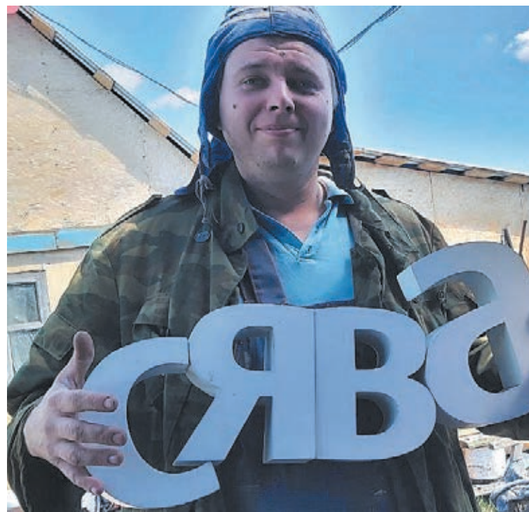
■ Фото из личного архива семьи Зинченко.

Василий отметил, что для садовода-любителя вырастить на своём участке арбуз – настоящая радость. «В самый урожайный сезон собрали около пятнадцати арбузов», – вспоминает кемеровчанин. – Растение очень требовательно к поливу. Среди других его особенностей можно выделить следующую: арбуз любит грунт с большим содержанием песка. Специально для него создаём искусственный песчанник. Арбуз прекрасно себя чувствует в той среде, где рыхло и сыро. К тому же замороженный арбуз – это вам не покупной во-