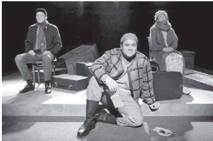
■ Фрагмент спектакля «О любви».