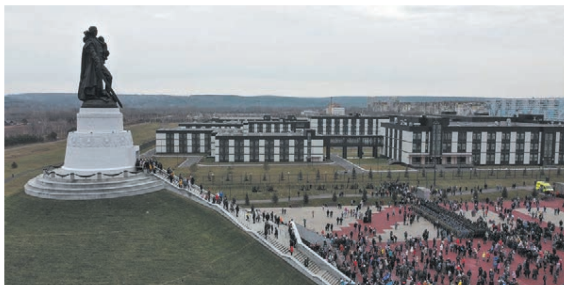
■ Фото Максима Киселева.