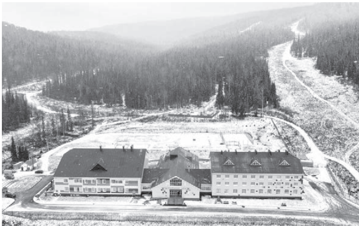
■ С 11 по 13 ноября в «Шерегеше» будет проходить праздничная программа в честь открытия сезона.