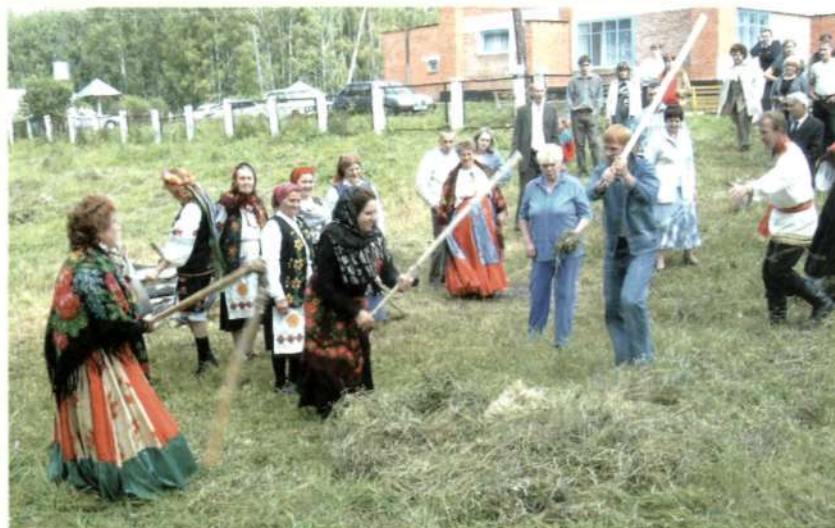
Обрядовая молотьба жита - на счастье молодым