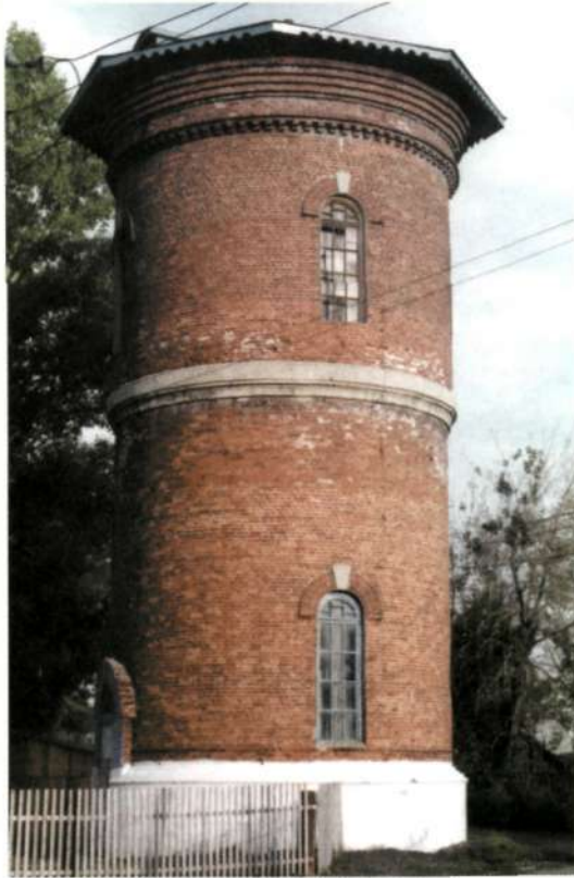
Водонапорная башня на станции Тяжин