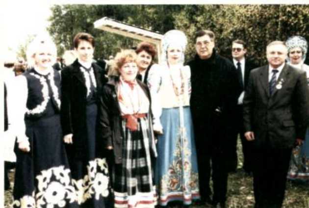
Губернатор Кемеровской области А.Г. Тулеев с участниками художественных коллективов района