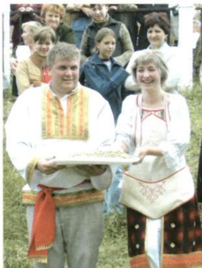
С полной чашей на всю жизнь!