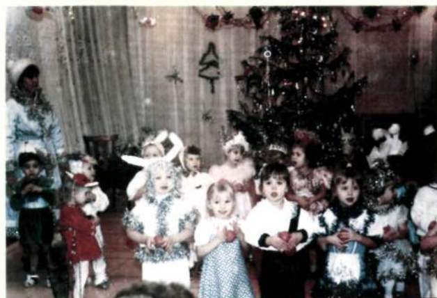
Молодое поколение тяжинцев