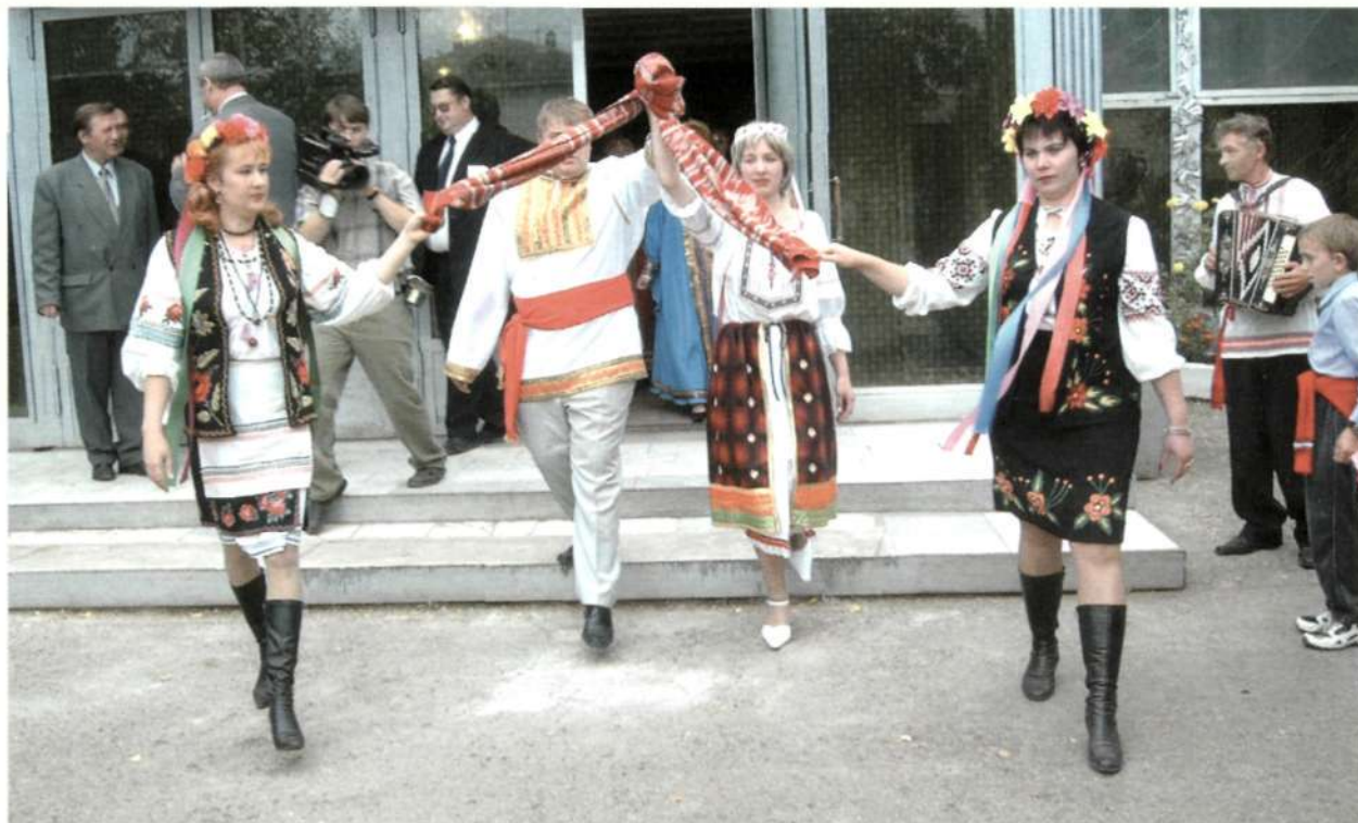
Старинный украинский обряд обручения

В августе 2004 года в районном центре состоялась фольклорная украинская свадьба, на которую были приглашены представители многих национальных диаспор Кемеровской области. От имени губернатора молодожены получили бюджетный займ на приобретение новой квартиры.