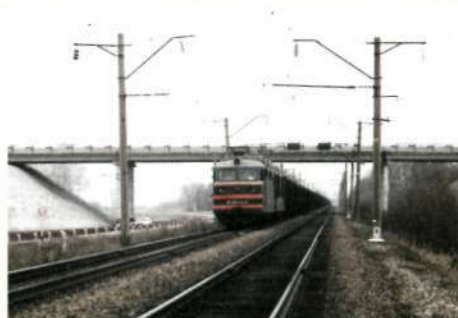
Транссибирская железнодорожная магистраль