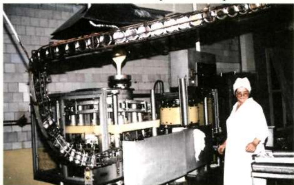
В главном цехе ОАО "Кузбассконсервмолоко"

В Тяжинском районе наибольшее развитие получили молочномясное и зерновое направления производства. Сельскохозяйственную отрасль района представляют 16 колхозов и производственных кооперативов, 9 фермерских хозяйств, подсобные хозяйства профессионального лица и промышленных предприятий, 5520 личных крестьянских подворий. Сельскохозяйственные производители района обрабатывают 96,4 тысяч гектаров пашни, содержат 10 тысяч голов крупного рогатого скота. В 2003 году продуктивность дойного стада составила 2522 кг, урожайность зерновых культур - 16 центнеров с гектара. В районе действует "Клуб тысячников" - мастеров машинного доения, надаивающих более 3000 кг молока за год на одну фуражную корову. В клуб входят 40 человек. Среди тяжинских животноводов уже есть мастера добывающиеся продуктивности более 4000 кг молока от каждой коровы. В сельскохозяйственной отрасли района трудятся 1700 человек, 13 из них удостоены звания «Заслуженный работник».