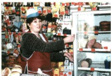
В торговой сети района насчитывается 169 предприятий