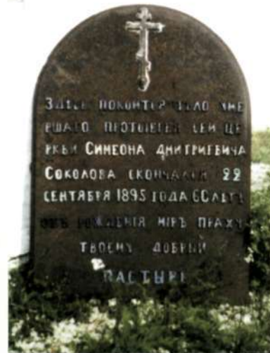
Плита с могилы протоиерея Симеона Соколова