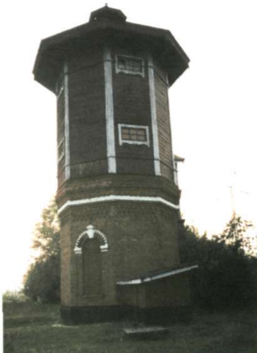
Водокачка на станции Итат