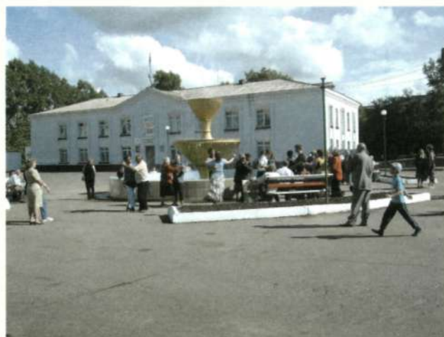
На центральной площади