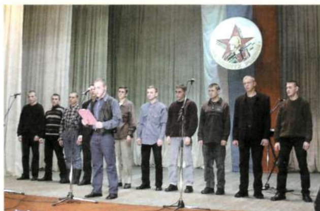
День призывника в районном доме культуры