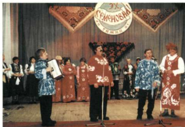
Конкурс частушек "Эх, Семеновна!"