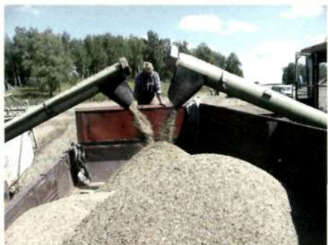
Хлеб нового урожая