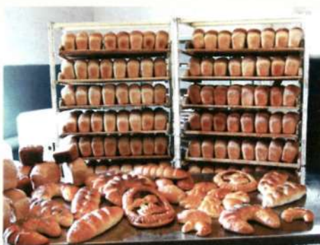
Продукция ОАО "Тяжинский элеватор"