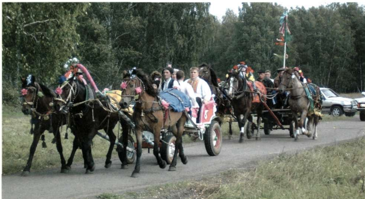
Катание на тройках