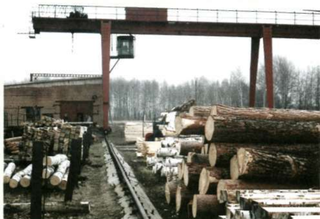
Лесная промышленность района