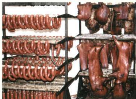
Продукция колбасного цеха Тяжинского сельпо