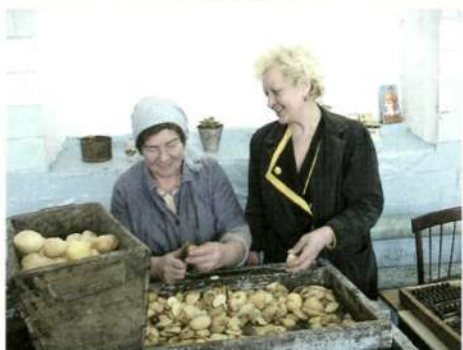
В цехах овощесушильного завода