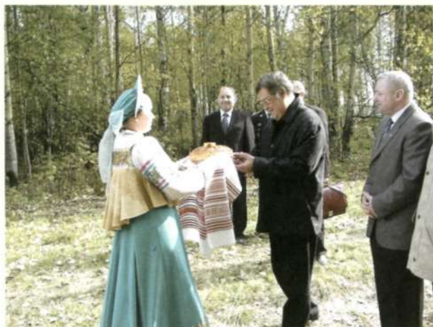
Хлеб да соль Тяжинской земли