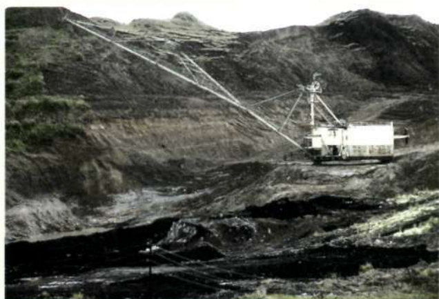
На Итатском угольном разрезе