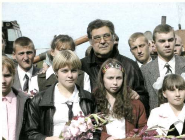
Губернатор Кемеровской области А.Г. Тулеев с участниками ученических производственных бригад