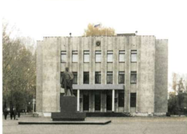
Здание Администрации Тяжинского района