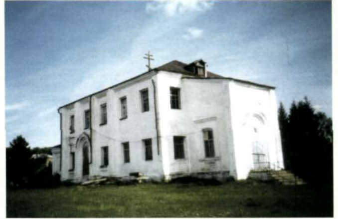
Никольский храм в поселке Итат