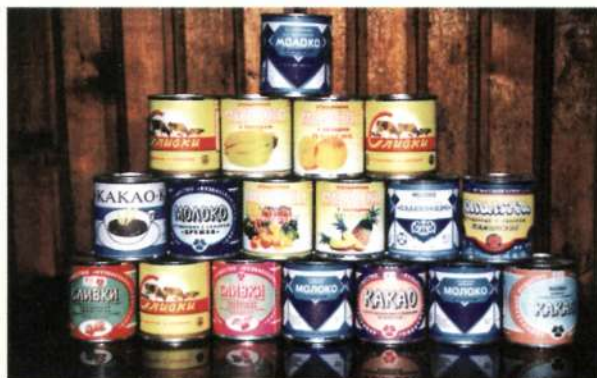
Тяжинское сгущенное молоко

В Тяжинском районе развита промышленность. ОАО "Кузбассконсервмолоко" является одним из крупнейших в регионе производителей молочных консервов. Предприятие постоянно принимает участие в региональных и российских выставках и ярмарках. Тяжинские молочные продукты неоднократно отмечались золотыми медалями и дипломами разных степеней за высокое качество, богатый ассортимент и разработку современных, передовых технологий. Пищевую промышленность района также представляют Тяжинский хлебокомбинат, Итатский овощесушильный завод, ОАО "Тяжинский элеватор", ООО "Бирон" Тяжинский пивзавод и колбасный цех Тяжинского сельпо. В районе ведется заготовка и переработка леса, добыча угля открытым способом. Имеются богатые залежи ильменитов, полезных ископаемых, используемых для производства ферротитана, высококачественных марок стали и титановых белил. Запасы ильменитов сохраняются для будущих поколений тяжинцев.