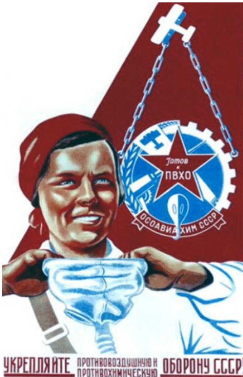
Плакат ОСОАВИАХИМА. СССР.

Подготовка к будущим военным испытаниям была всеобщей. Особенно массовой была сдача норм на значок ГТО (Готов к труду и обороне). Так, во втором квартале 1934 года 275 человек сдали нормы ГТО. Примечательно, что среди них было 78 женщин. От взрослых не отставали и дети. Летом следующего года так называемый пионерский значок ГТО получили 234 человека, из них 114 девочек.