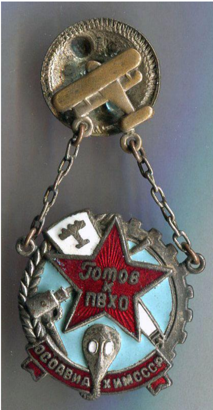
Нагрудный знак «Готов к противовоздушной и химической обороне». СССР.