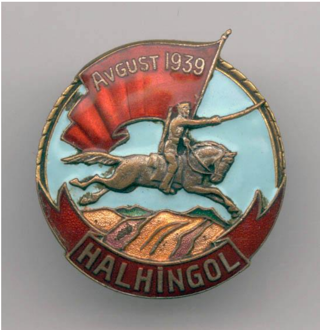
На снимке: Нагрудный памятный знак участникам боёв в Монголии. 1939 год.

В городской газете «Знамя ударника» постоянно публиковались краткие обзоры о ходе боёв с противником. Не успели разгромить японцев, пришла новая беда – на западных границах нашей страны активизировались гитлеровцы.