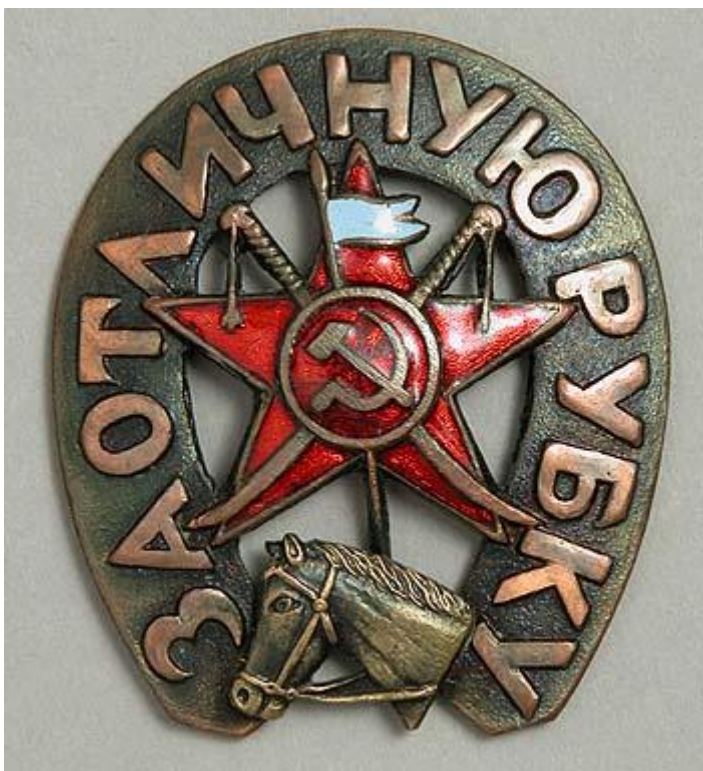
На снимке: Нагрудный знак «За отличную рубку». Из частной коллекции. Москва.

Когда началась финская война, в действующую армию одними из первых ушли воспитанники кавалерийских курсов, взяв с собой на фронт и лучших лошадей с конефермы. К сожалению, многие из них не вернулись в родное село.