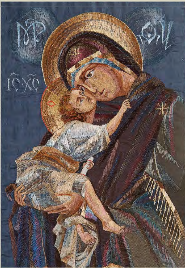
Гликофилуса. 2014. Аппликация, вышивка гладью 30x20