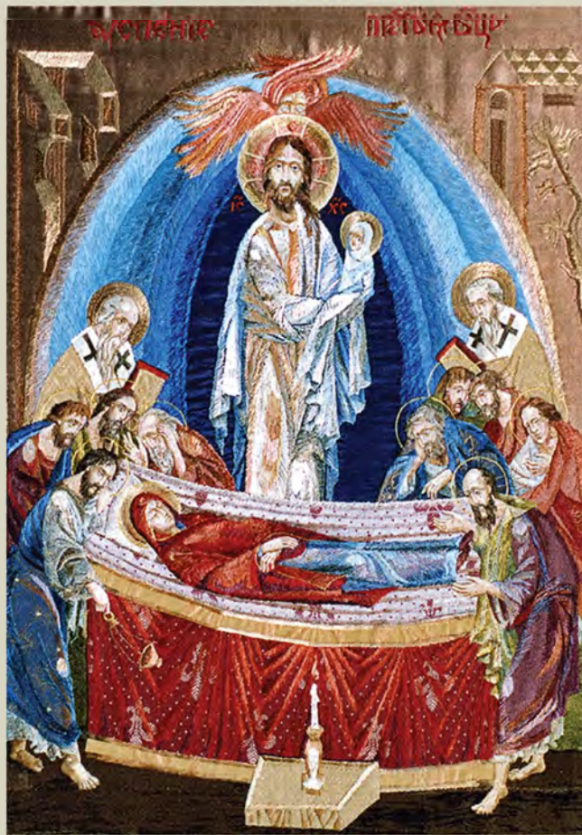
Успение Богоматери. 2007. Аппликация, вышивка 74x54