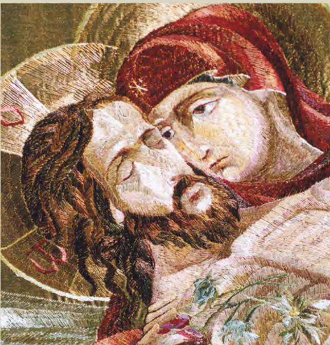
Положение во Гроб. 2008. Фрагмент. Аппликация, вышивка гладью 54x54