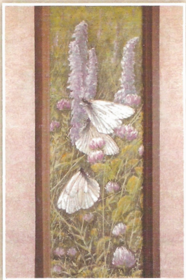
Картина с бабочками