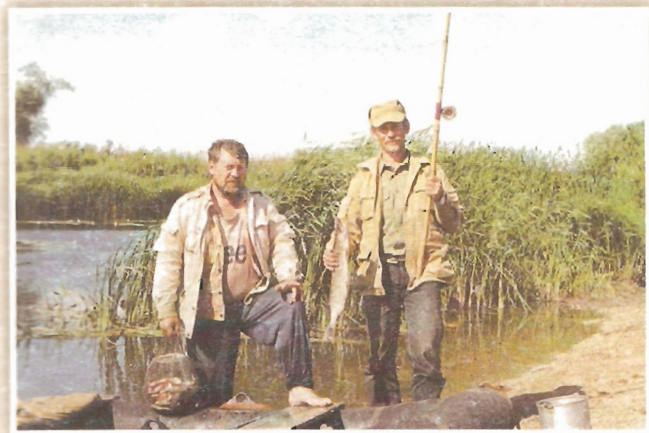
Я с братом на рыбалке